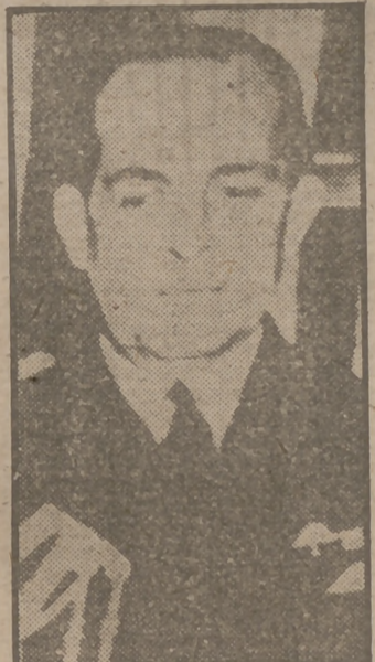
Pablo de Grecia, Rey desde ayer por fallecimiento repentino de su hermano Jorge. Según declaraciones de los Gobiernos norteamericano e inglés, la sucesión real no afectará a la política proteccionista anglonorteamericana en relación con Grecia.