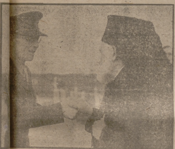
Al ir Inglaterra para dirigirse a su país, el Rey Jorge es recibido por el arzobispo germano, jefe de la Iglesia ortodoxa griega en Inglaterra.