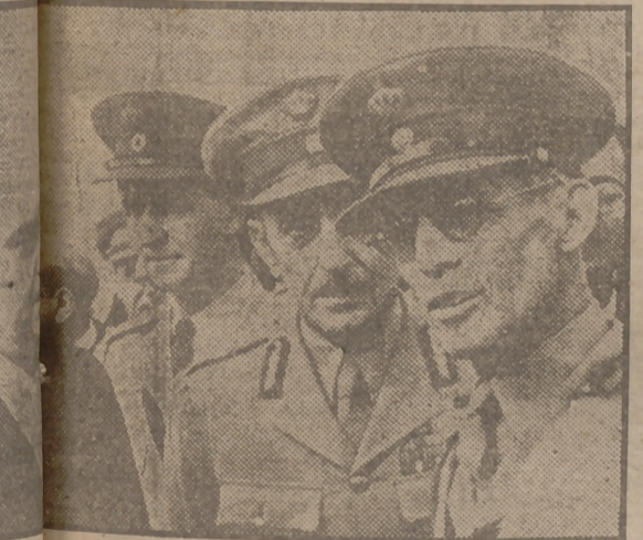
A su llegada a Atenas, el Rey Jorge fué recibido por numerosos soldados. De izquierda a derecha figuran en la foto el ministro, Tsaldaris, un oficial de la Guardia Real, el coronel griego, Alejandro Papagos, jefe de las fuerzas que lucharon en Italia y alemanes, y el Rey Jorge.