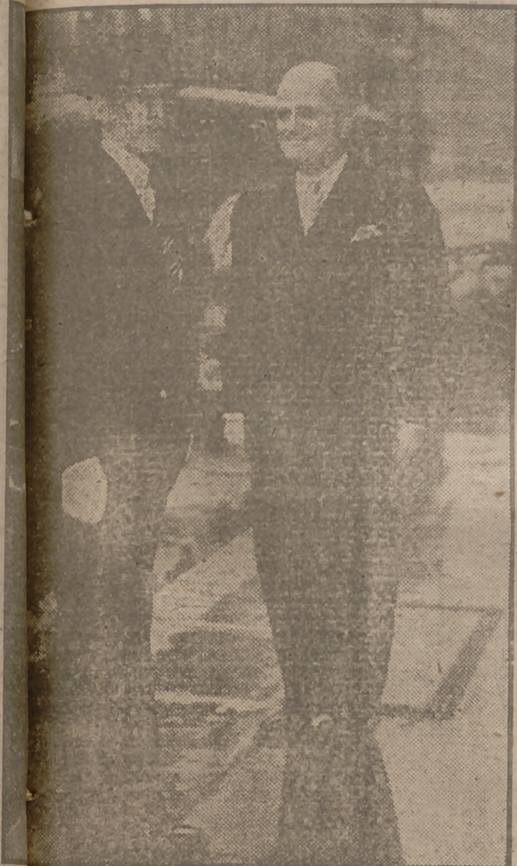
La primera fotografía obtenida a la llegada de Tsaldaris para informar al Monarca griego del resultado de las elecciones que determinaron la vuelta a Atenas de Jorge II.