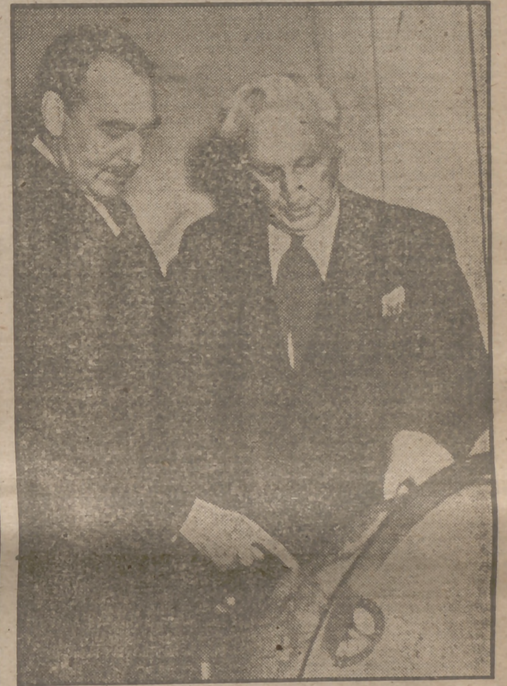
Dan Acheson, secretario interino de Estado, y Charles R. Eaton, presidente del Comité de Asuntos Extranjeros de la Casa Blanca, señalan en el globo la posición de Grecia y Turquía, amenazadas por el imperialismo ruso.

WASHINGTON, 2 (1 t.).—La división de opiniones en el Senado norteamericano sobre la ayuda a Grecia y Turquía va a determinar que esta cuestión sea sometida a las Naciones Unidas, según comunica la United Press. Algunos de los senadores que discrepan estiman que la organización mundial podría resolver el problema satisfactoriamente, y otros opinan que, por el contrario, la intervención de dicho organismo podría debilitarlo.