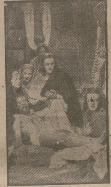
Alida Valli, la inolvidable intérprete de "A las nueve, lección de Química"...