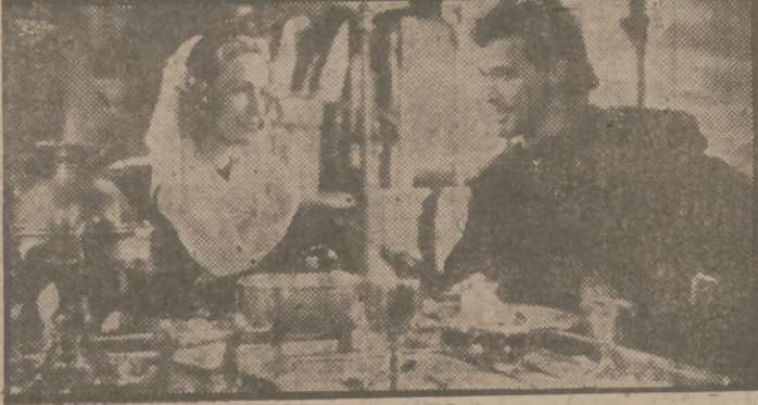
Maruchi Fresno y Antonio Villar en una escena de "La Reina Santa", verdadera joya del séptimo arte...