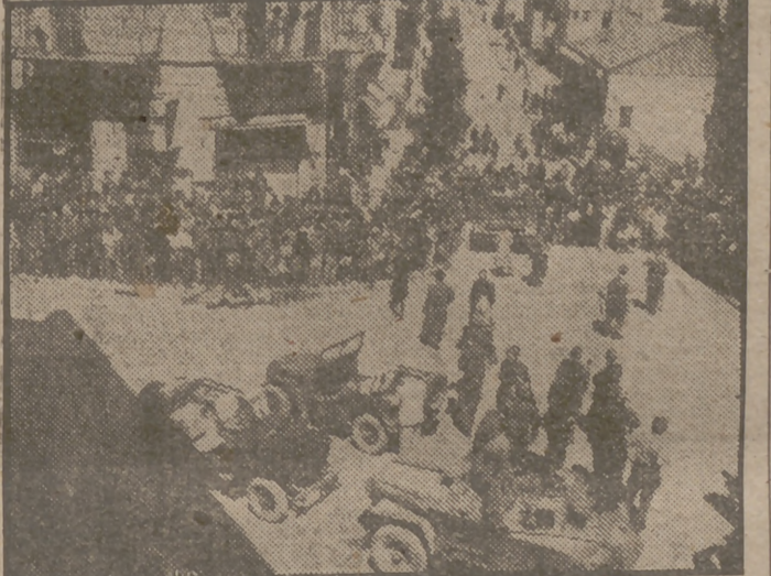
Al mediodía del día 17 dejó de regir la ley marcial en Jerusalén, que había sido impuesta quince fechas antes a consecuencia de la gravedad de las últimas revueltas a causa de las cuales perecieron 20 personas y heridas 26. He aquí un aspecto de una calle un cuarto de hora antes de cesar la ley de excepción.