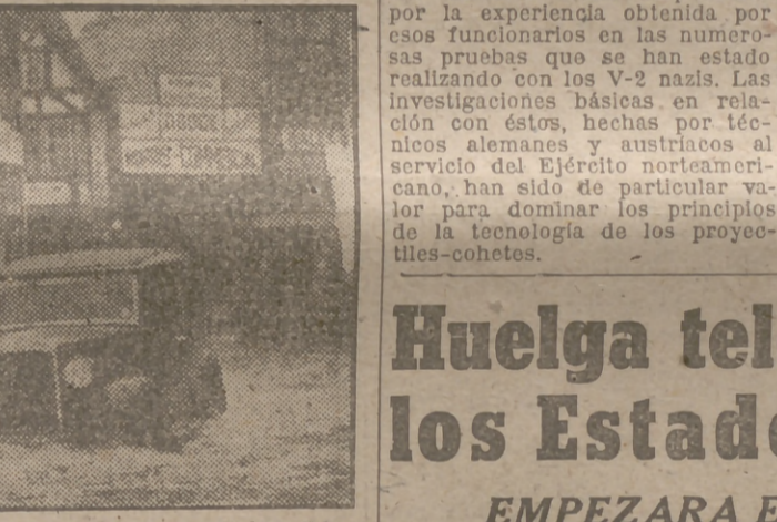
Las inundaciones en Inglaterra, como las de otras muchas poblaciones inglesas, se ven invadidas por las aguas que se han colocado en pasarelas que permiten el tránsito.