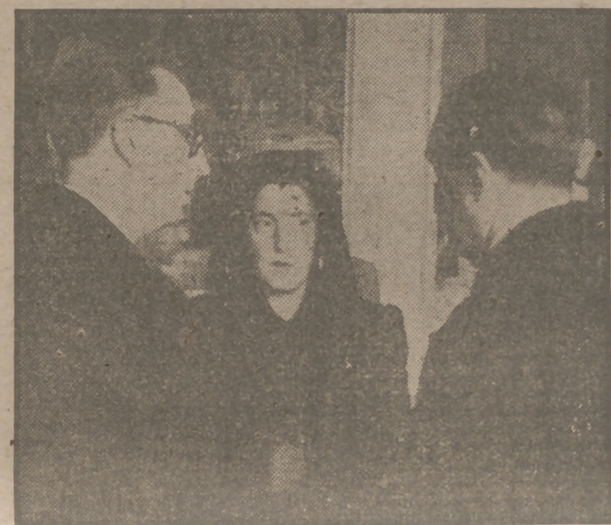
En la capilla ardiente donde ha sido expuesto hoy el féretro que guardan los restos del glorioso general Primo de Rivera oró esta mañana el Generalísimo Franco y oyó misa con su Gobierno. También asistieron los hijos del preclaro soldado.