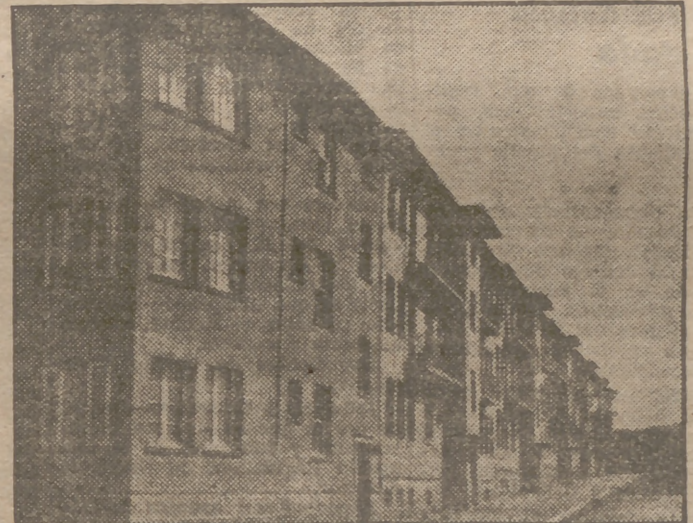
Aspecto del Grupo General Moia, en Orense, con treinta y seis viviendas de renta módica para productores y empleados.

Ciento sesenta viviendas protegidas en Segovia. La C. N. S. de Valencia abre concurso de artículos periodísticos.—Labor económica social de la C. N. S. de Barcelona.—Bendición de una imagen en Alicante.—Un congreso de dos metros de longitud y 25 kilos de peso.—El secretario nacional de Sindicatos, en Murcia