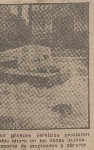
Los tanques Sherman, que tan grandes servicios prestaron durante la guerra, son empleados ahora en las zonas inundadas de Inglaterra para el transporte de empleados y obreros a sus centros de trabajo.