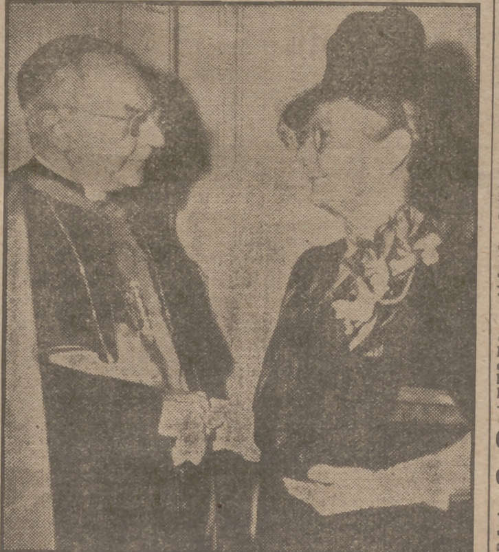
El cardenal Strich, arzobispo de Chicago, impuso la medalla de la madre católica de 1947 a mistress Math Lies, que lo es de catorce hijos.