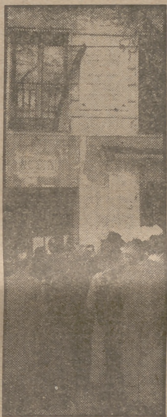
En la calle de Bailón, número 15, donde residió el gran poeta hispanoamericano Amado Nervo, el Ayuntamiento de Madrid, como homenaje a la memoria del insigne vate, ha descubierto esta mañana una lápida conmemorativa. (Información en página 5.)