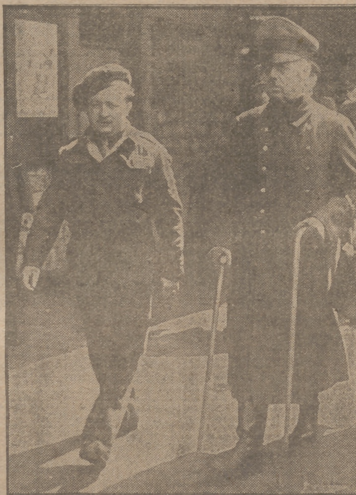
He aquí a Von Rundstedt, ex mariscal de los Ejércitos del Reich. Sin insignias en su uniforme y con dos bastones, la figura del viejo soldado alemán personifica el Ejército de un pueblo vencido.

El lunes publicaremos en esta página "EL SECRETO DE LA DERROTA ALEMANA EN RUSIA".