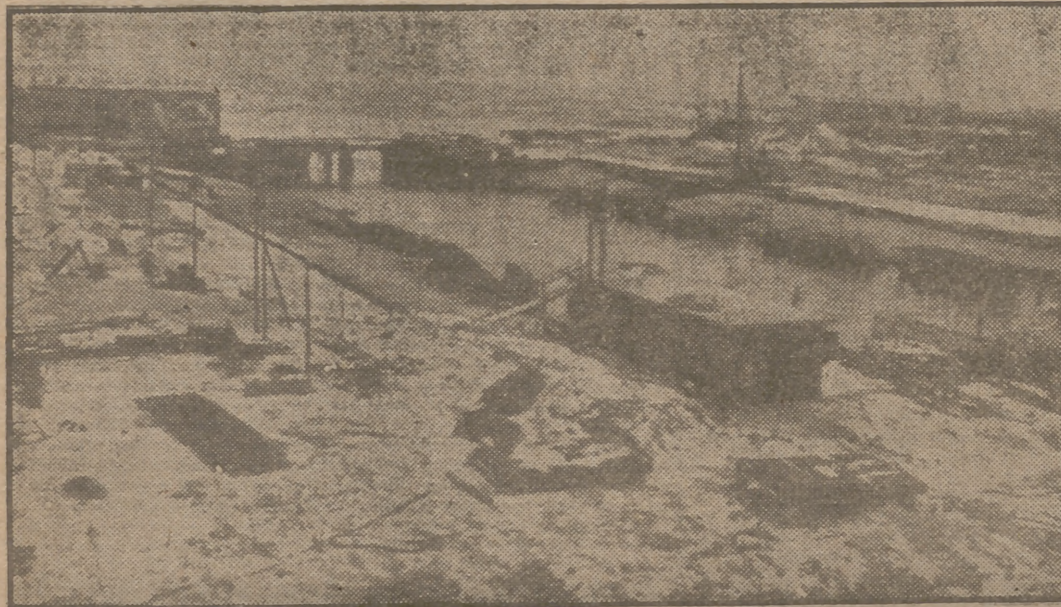
Desolado aspecto del puerto de Dunkerque después de la evacuación británica.

EJECUTADOS los hombres de Nuremberg quedan pendientes de juicio en otros lugares algunos de los más esclarecidos jefes militares alemanes, como von Rundstedt, von Thoma, von Kleiser y otros reclamados por los países que fueron teatro de sus hazañas.