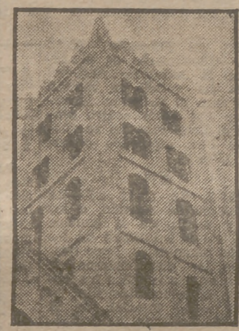
La torre cuadrada del Monasterio de Ripoll, de 40 metros de altura.

PODRAN VISITARNOS DOSCIENTOS MIL NORTEAMERICANOS CADA AÑO