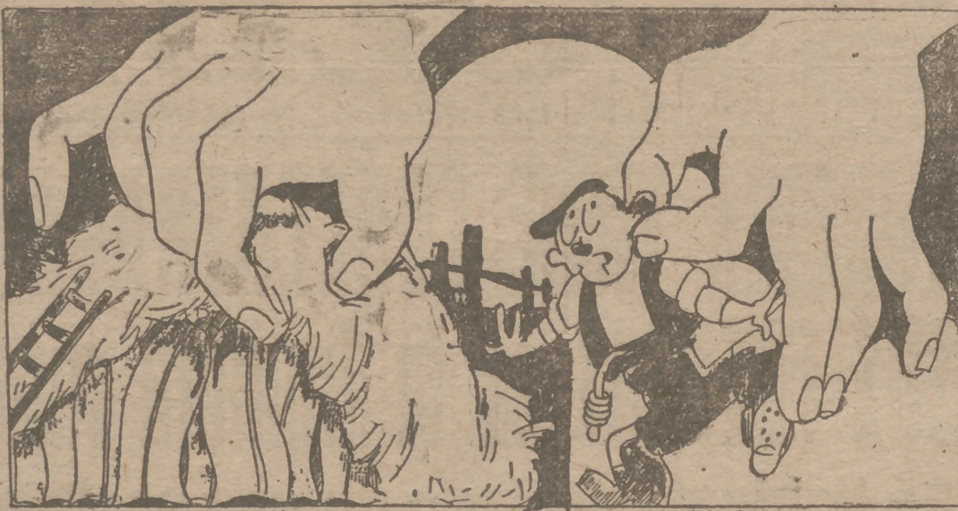
Una cosa es cobrar lo justo y otra... guardar el trigo...