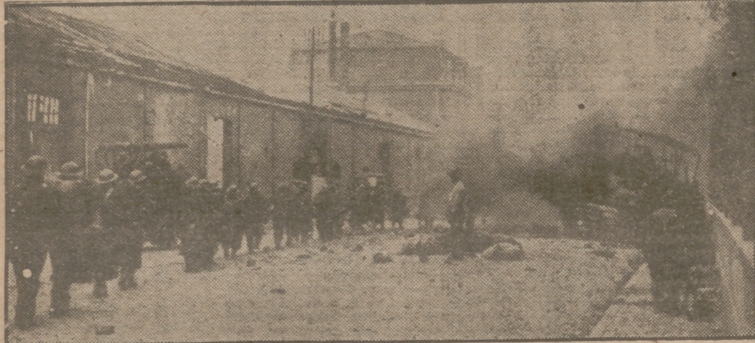
Fuerzas inglesas dispuestas a abandonar Dunkerque ante la proximidad de los ejércitos alemanes cruzan una calle de la ciudad en dirección al puerto después de un trágico bombardeo.