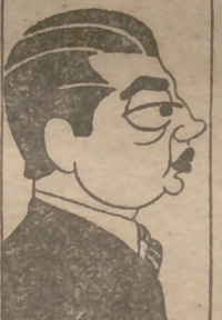
J. A. B.