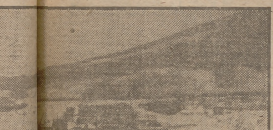
Una gran flota fluvial bloqueada por los hielos en pleno Danubio.

La navegación en Bulgaria, Yugoslavia y Hungría, igual que en el resto de Europa oriental, se ve seriamente afectada por los grandes bloques de hielo que permanecen en las aguas del Danubio.