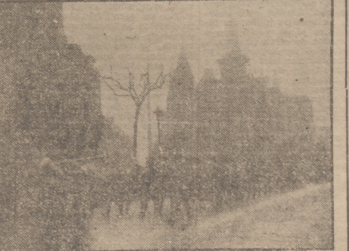
La Policía Armada de Barcelona, con motivo de la festividad de su Patrón, el Santo Angel de la Guarda, desfila ante las autoridades. (Foto Gifra.)

VALENCIA, 4 (2 t.).—El secretario Nacional de Sindicatos, acompañado del vicesecretario, ha visitado todas las dependencias. Fué recibido por todas las jerarquías provinciales y locales, con las cuales compartió, dándoles consignas de momento para el mejor cumplimiento de las tareas sindicales. (Gifra.)