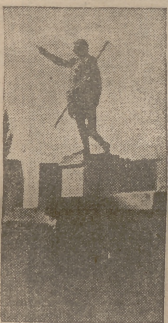
Una importante reforma en Tarragona

La Comisión Municipal Permanente de Tarragona, en reciente reunión, ha adoptado un acuerdo de la mayor importancia para la capital catalana: la parcelación y urbanización del solar de Santa Clara. Dada la situación de esos terrenos su urbanización viene a solucionar viejos problemas de acceso y edificación que afectan extraordinariamente a Tarragona. Así, por ejemplo, el paso a la plaza de Santa Clara desde el paseo podrá verificarse ahora por medio de una escalinata suave cuyos tramos irán jalados por parterres y pequeñas plantaciones; para coches el acceso se verificará ampliando la calle del mismo nombre. En cuanto a la futura edificación de los terrenos, éstos se han dividido en ocho solares, dos de ellos con fachada al paseo, edificios de los últimos que serán comenzados próximamente. Esta reforma importantísima, junto con el terminado parque del Milagro, completa una entrada a la capital tarragonense por todos conceptos magnífica.