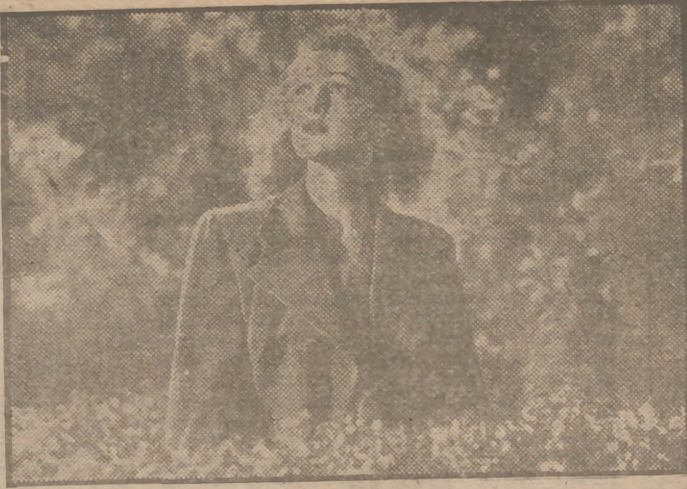
Virginia Grey, considerada como la mujer más bella de Norteamérica, es protagonista de "¿Crimen o suicidio?", la más sorprendente película de la presente temporada que será presentada por Ultraguí mañana, jueves, en el suntuoso Palacio de la Prensa.