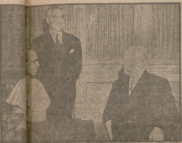
En audiencia, Su Santidad Pío XII ha recibido al ex Presidente Hoover. Treinta y cinco minutos duró la conferencia.