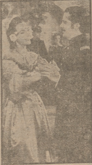
Lyn Bari y Jon Hall en una escena de "Kit Carson", la mejor de las películas de las realizadas sobre las guerras del Oeste, el film de las grandes masas en el que intervienen más de cincuenta mil extras. Esta cinta, que llega a nuestras pantallas avalada por el éxito obtenido en el extranjero, será presentada por Exclusivas Floralva mañana, jueves, en el cine Avenida.

"¿Crimen o suicidio?" ha sido calificada por la crítica americana como la película más intrigante que ha de impresionar profundamente al gran público del suntuoso cine del Palacio de la Prensa.