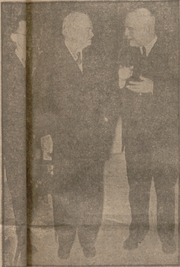
En honor de Hoover, ex Presidente de los Estados Unidos, ha en Roma, se celebró un banquete en la Embajada Norteamericana. De izquierda a derecha vemos en la foto a Gasperi, a Hoover y a Carlo Sforza.