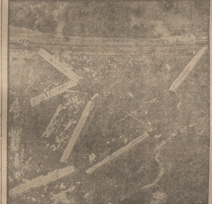
El tren llamado "Flecha Roja", que presta servicio entre Detroit y Nueva York, descarriló durante la noche en un paraje conocido por "La Herradura", cuando la mayoría de los viajeros dormían. Veintinueve muertos y 117 heridos fué el balance del desastre, de cuyas dimensiones da idea esta foto aérea del convoy descarrilado.