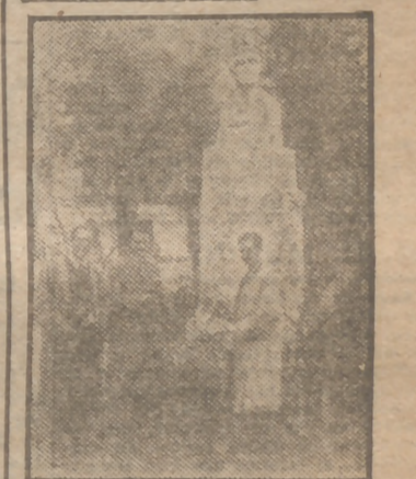
Los artistas cordobeses han ofrecido flores ante el busto del escultor cordobés Mateo Inurria, con motivo del aniversario de su muerte.

Trajes señora, caballero; gabanes, gabardinas, canadienses, en Plaza del Matute, 2.