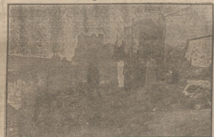
Una vista del derrumbamiento de tierras del Museo Arqueológico Provincial de Badajoz, que sepultó varias casas en donde murieron siete personas.

Un mayor argentino estudia nuestra antigua legislación militar en el Archivo de Indias.—El volterio febrero y Sevilla.—El turismo de los marinos ingleses.—La vega de Aranjuez, inundada. El ministro de Marina se reúne con las autoridades de Las Palmas.—El ministro de Agricultura regresa a Madrid.