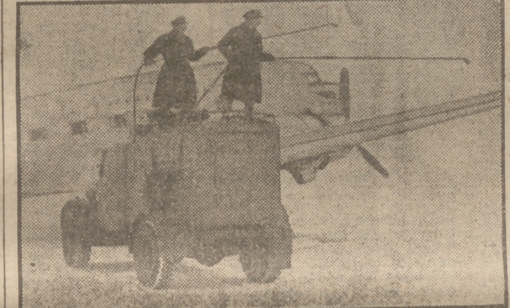
Mecánicos del aeródromo de Northolt, cerca de Londres, limpian de hielo las alas de un avión antes de iniciar el vuelo.