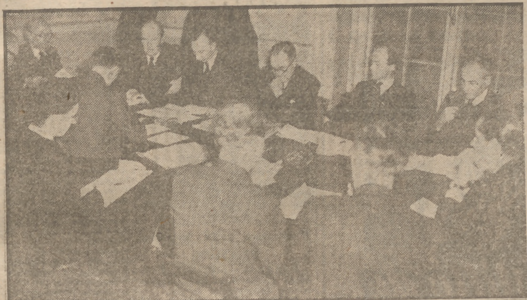
En Londres se ha reunido la Oficina de Seguridad Aérea, convocada con urgencia por lord Nathan, ministro del Aire, para discutir el límite de carga de los Dakotas utilizados en las líneas de pasajeros. (Foto A. P.)

parte en un concurso de tiro celebrado en la didos en el suelo y tras ellos a las princesas res. (Foto A. P.)