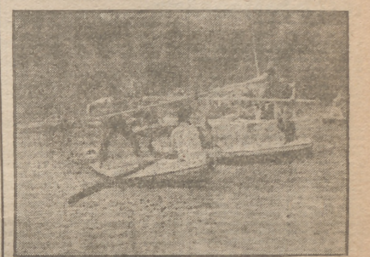
En el río Pisuerga, lucha de pértigas entre productores vallsoletanos.

Aquella noche nevaba despiadadamente sobre Valladolid. No transitaba un alma por la blanca superficie de sus calles. En este medio llegamos al gimnasio instalado en los sótanos de la Casa Sindical vallsoletana, donde se celebraba una velada de boxeo entre productores. Por el camino el cronista rumiaba la sospecha fundada de que con aquella noche allí no habría un alma; pero allá íbamos porque al periodista, en el cumplimiento de su misión, no le arredran ni los "chuzos de punta". Y llegamos por fin, y, contra lo que suponíamos, el gimnasio estaba abarrotado de productores que jaleaban la lucha, y allí estaban también las jerarquías, pues ni unos ni otros se acordaban antes lo inclemente de la noche. Francamente, encontré magnífico este espíritu que Meléndez ha sabido inculcar a sus muchachos de Educación y Descanso. Después de esto no me sorprendió al día siguiente descubrir mil detalles de la pujante y fructífera vida de la C. N. S. de Valladolid.