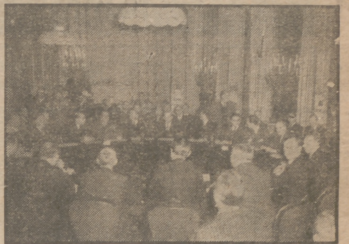
Mr. Ernest Bevin, ministro de Asuntos Exteriores de Inglaterra, presidió la sesión inaugural de la Conferencia de Ministros preparatoria de los Tratados de paz con Alemania y Austria. El acto tuvo lugar en la Lancaster House