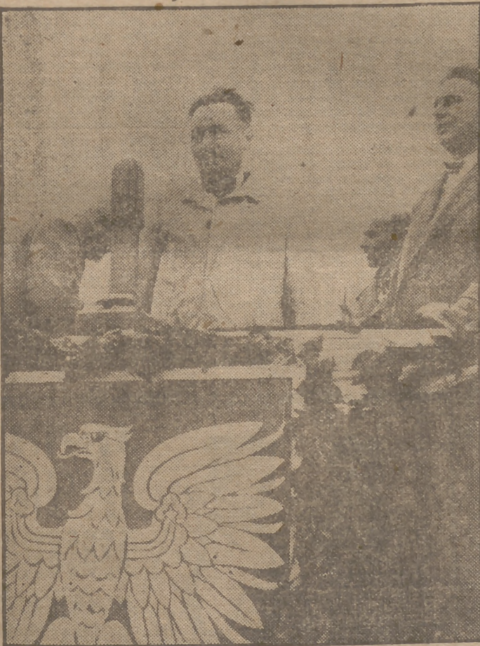
El Parlamento de Varsovia ha elegido Presidente de la República a Biersut, quien desempeñaba ya esta cargo provisionalmente, según comunica la Agencia United Press. Biersut obtuvo 408 de los 433 votos emitidos. En la fotografía aparece Biersut en un acto político acompañado del primer ministro de Polonia, Morawski.