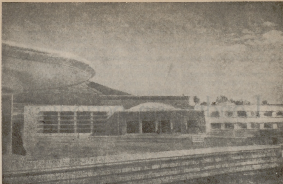
En este moderno edificio de la ecuatoriana Universidad Central, se halla instalada la Escuela de Periodismo

periódico de la Escuela de Periodismo de Quito, donde se tratan con garbo temas de letras y de arte. Reproduce los óleos "El sembrador de lágrimas" y "Sed", del gran pintor ecuatoriano E. Kingman.