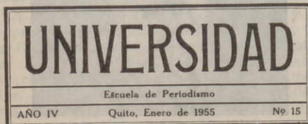
Cabecera del periodico que hacen los alumnos de la Escuela de Periodismo de Quito.

En esa carta-circular nos decían a los españoles que "el significativo y valioso aporte de Vds. a la Exposición que nos proponemos realizar tiene desde ya la acogida cordial y grata que los estudiantes ecuatorianos saben dispensar a todo cuanto haga referencia a la cultura y al desarrollo de los pueblos; la misma cordial y grata acogida que dispensamos a los numerosos envíos que llegan hasta nosotros frecuentemente, desde rincones diferentes del orbe, que los conocemos y admiramos