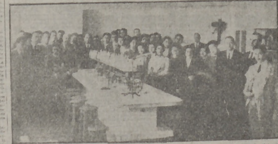
Los alumnos del Instituto Español en Lisboa...