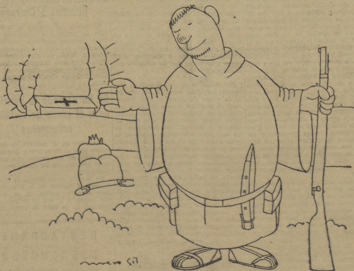
—NOS CONFORMAMOS CON BOMBARDEAR LOS HOSPITALES...