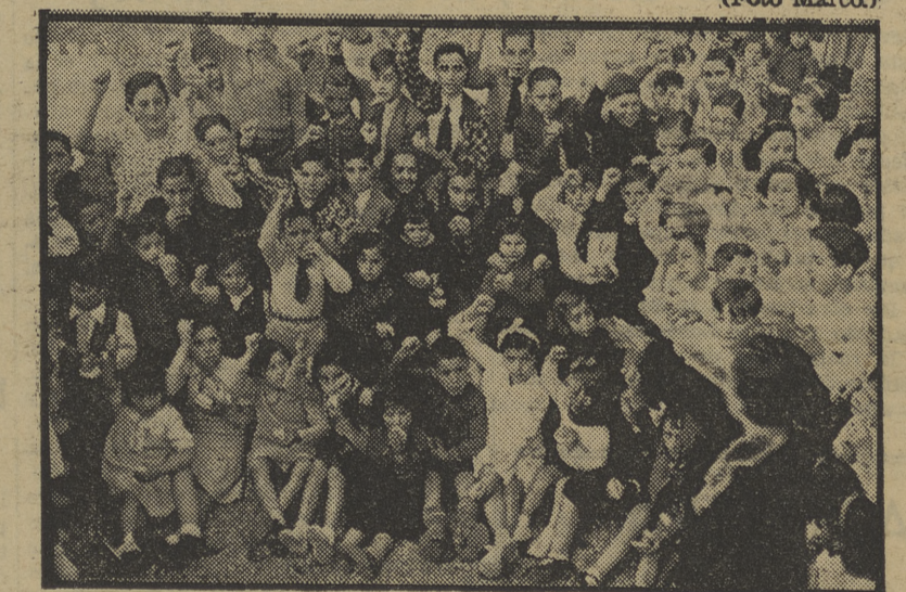
Una foto de un grupo de niños huérfanos asturianos, recogidos por la «Asociación Pro-Infancia Obrera», después de octubre, tomada durante una fiesta.