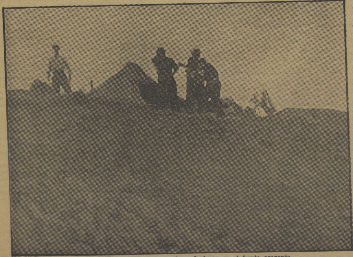
Puesto de observación en una choza de barro en el frente aragonés

la ciudad. Por fin se sometió el caso a votación, y habiendo empatado, lo resolvió el obispo, votando a favor de la resistencia.