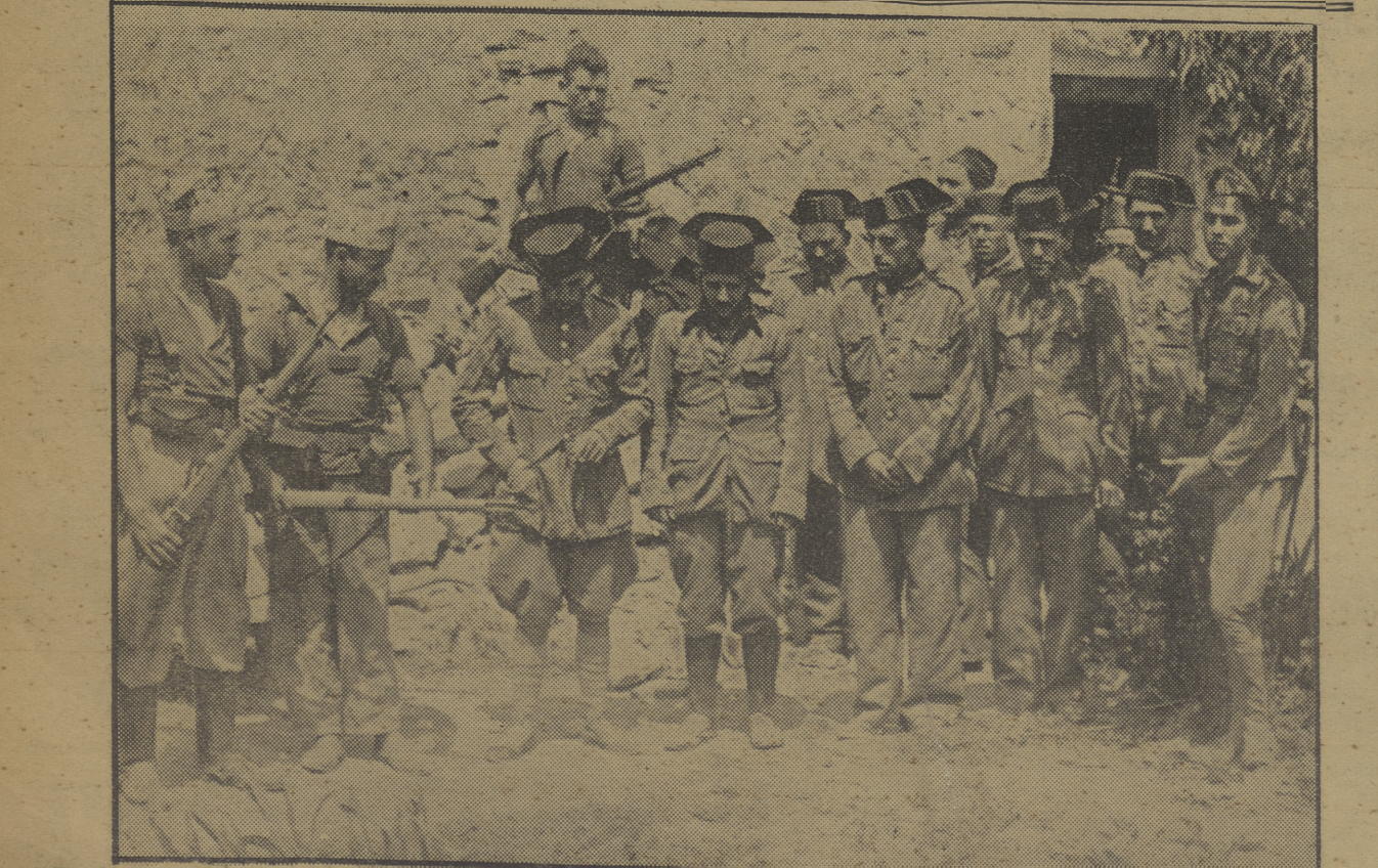
Fascistas disfrazados de guardias civiles que vayeron en poder de la columna de Castellón después de la derrota que infligió a los fasciosos en Rubiolo de Mora