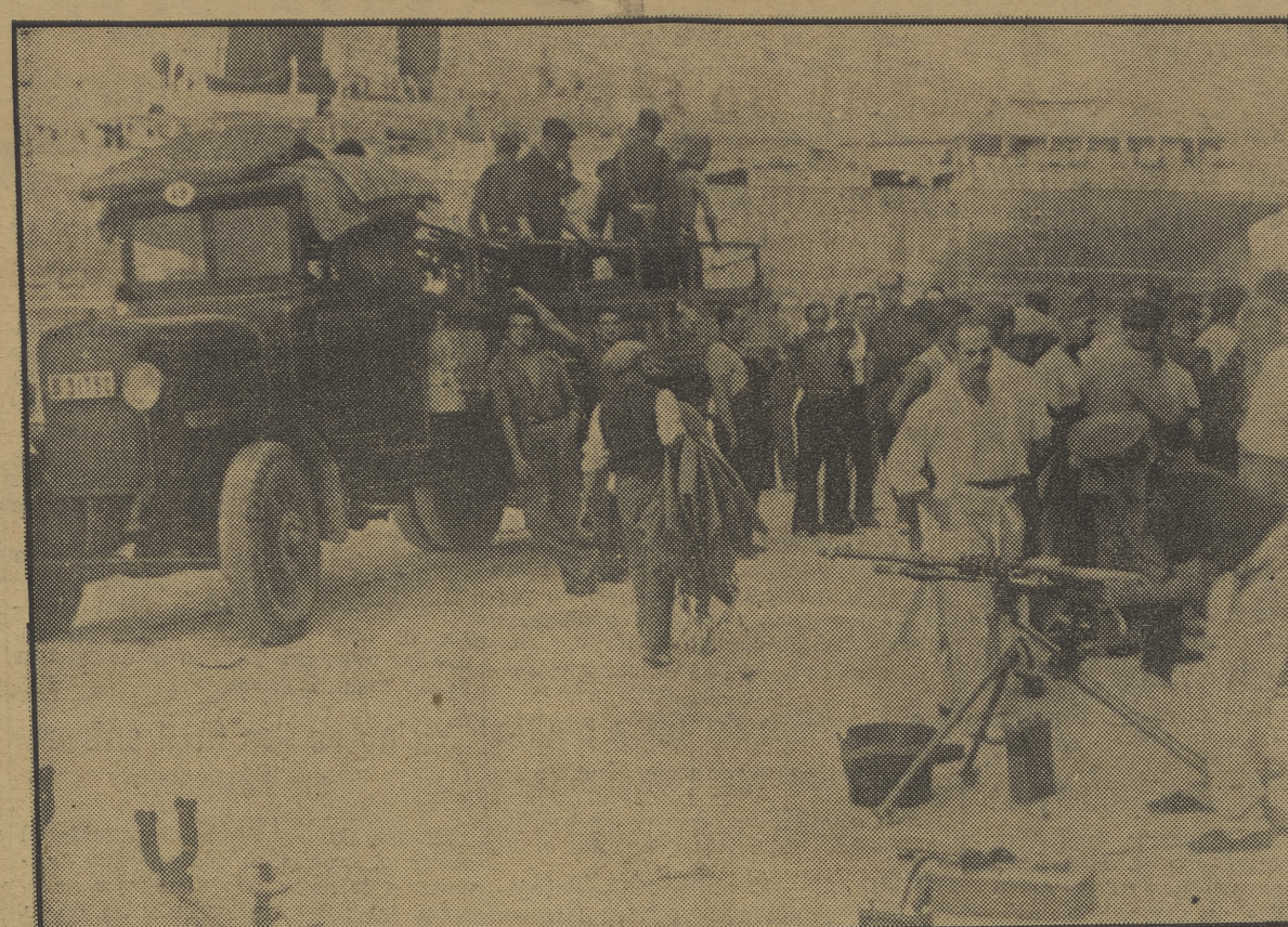
Preparativos en el muelle de Mahón para el embarque de fuerzas que marchan a Palma de Mallorca

Madrid, 17.—Se pone en conocimiento del personal organizado que trabajaba en el diario «La Tierra», que se ha verificado la incautación de los talleres y oficinas de dicho periódico por cuyo motivo pasarán por Jarines, 4 y 6, aquellos compañeros a los que debiera normales la empresa.