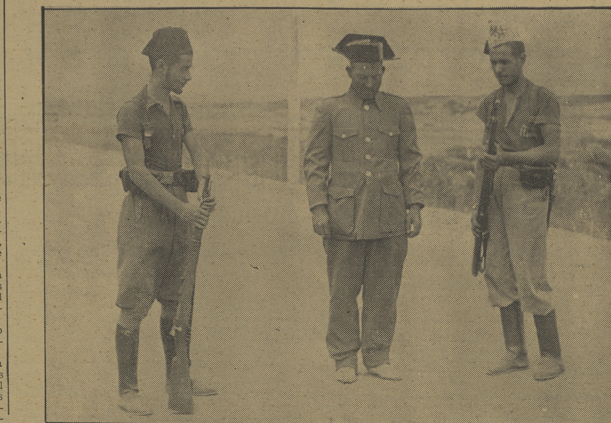
Un fascista disfrazado de guardia civil detenido en las inmediaciones de Rubiolo de Mora por la columna de milicianos de Castellón