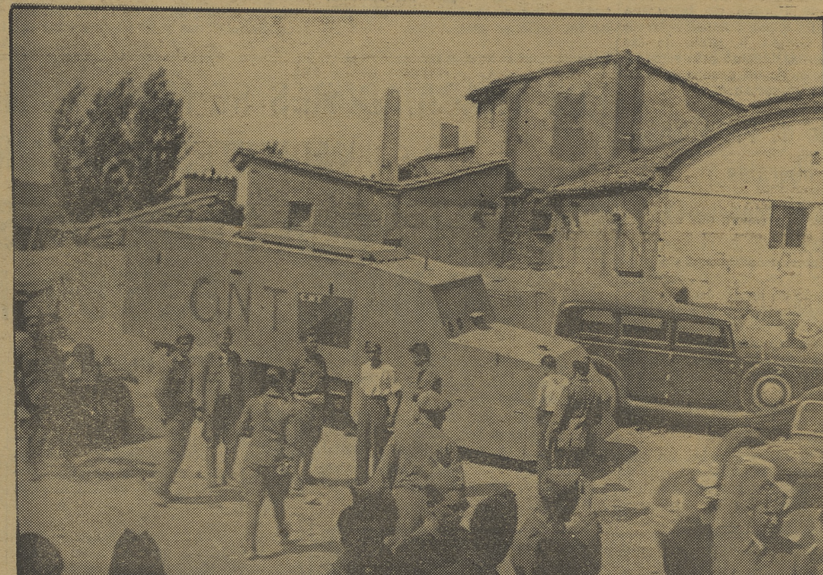
Camiones blindados en la plaza de Alcalá del Obispo