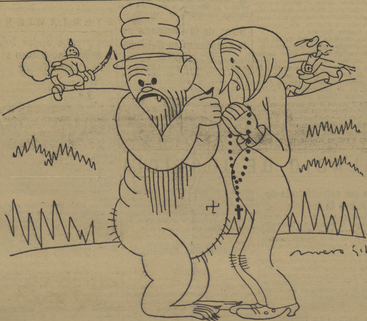
—HA LLEGADO NUESTRA ULTIMA HORA... —CONFEMOS EN DIOS... —A EL TAMBIEN LE HA LLEGADO...

En todo el recorrido, los obreros, en compacta multitud, han ovacionado y saludado con entusiasmo a los jinetes rojos. Estos constatan blandiendo al aire el acero de sus sables. Pero el desfile de los jinetes del P. O. U. M. no es un simple paseo militar, una de esas exhibiciones tan habituales en el antiguo-antiguo a pesar de que hace sólo un mes aún existía—Ejército español. Los muchachos marchan al frente, a luchar con las columnas obreras que se preparan para lanzarse sobre Zaragoza y Huesca. Por la estación del Norte, a última hora de la tarde, partieron los milicianos que componen el escuadrón, con toda su impedimenta y con los caballos. En días sucesivos irán partiendo otros escuadrones a engrosar este primer escuadrón de caballería del ejército proletario que se está formando. Han salido del cuartel de Tarragona, donde se halla el centro de organización de la caballería obrera. Desde allí han avanzado por la calle de Cortes, Pelayo, Ramblas, se han detenido unos instantes ante el local central de nuestro Partido y han marchado a la estación del Norte.