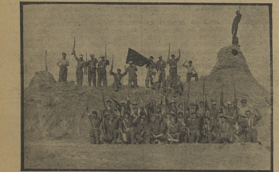
Las avanzadillas del teniente Villegas, en Casa Postas, próximo a Navalnoral (Cáceres).

¡OBRERO, NO TE DEJES ARREBATAR EL FUSIL!