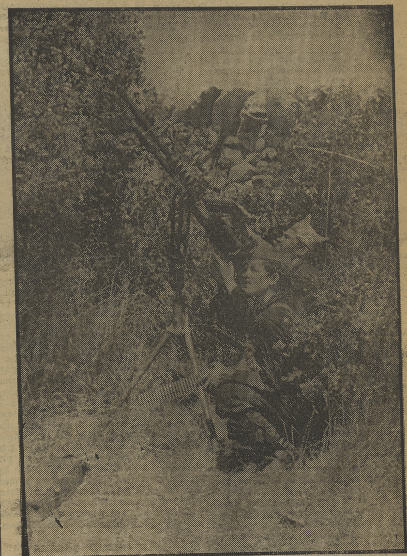
GUADARRAMA.—Ametralladoras anti-aviones disparando sobre los aviones enemigos.

El acta de la ejecución, dice: «Cumplimentando órdenes del Comité Antifascista y de acuerdo con el resultado del Consejo de Guerra celebrado y del que ha resultado la aplicación de la pena de muerte, los abajo firmantes certificamos que Goded y Burriel