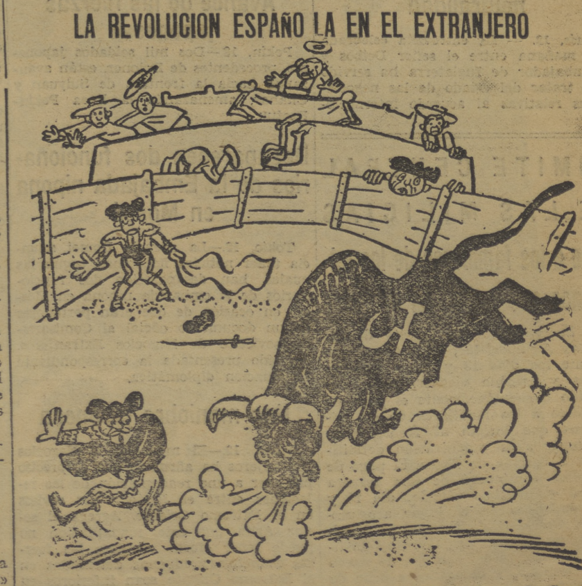
Del «Folkets Bladet», órgano del Partido Socialista Obrero de Suecia

Madrid, 12.—Ha sido reorganizada la redacción del diario republicano «A B C», encargándose de la dirección el diputado