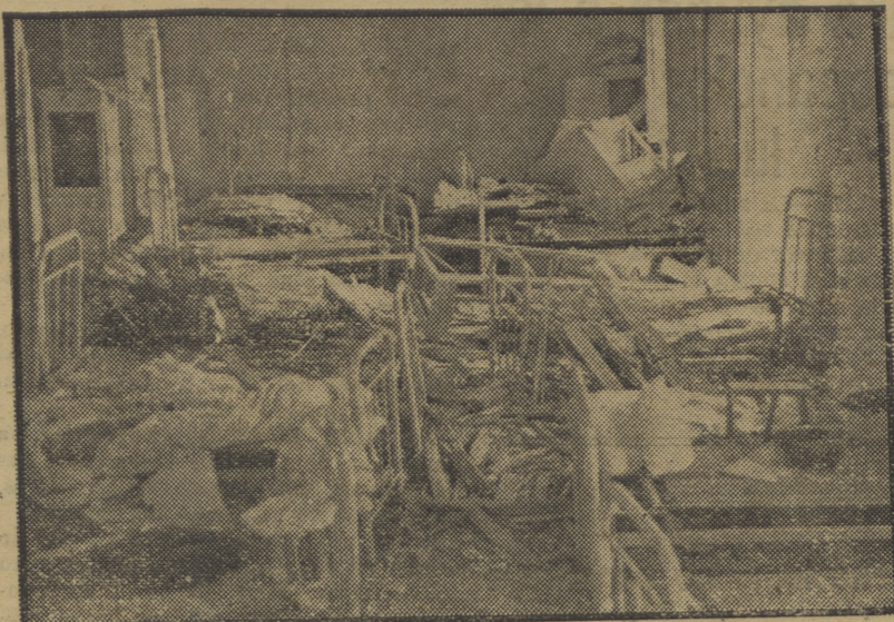
Destrucción causada en un hotel de Guadarrama, habilitado para dormitorio de la guardia civil, por efectos del bombardeo enemigo.

—Hoy ha sido un día de descanso para las tropas, que bien se lo merecen.