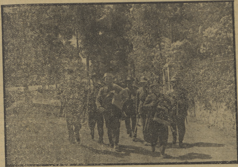
Guardias civiles y soldados dirigiéndose a la línea de combate en el Guadarrama.

Después de un combate de cuatro horas, Deyfante ha sido ocupado por las fuerzas leales