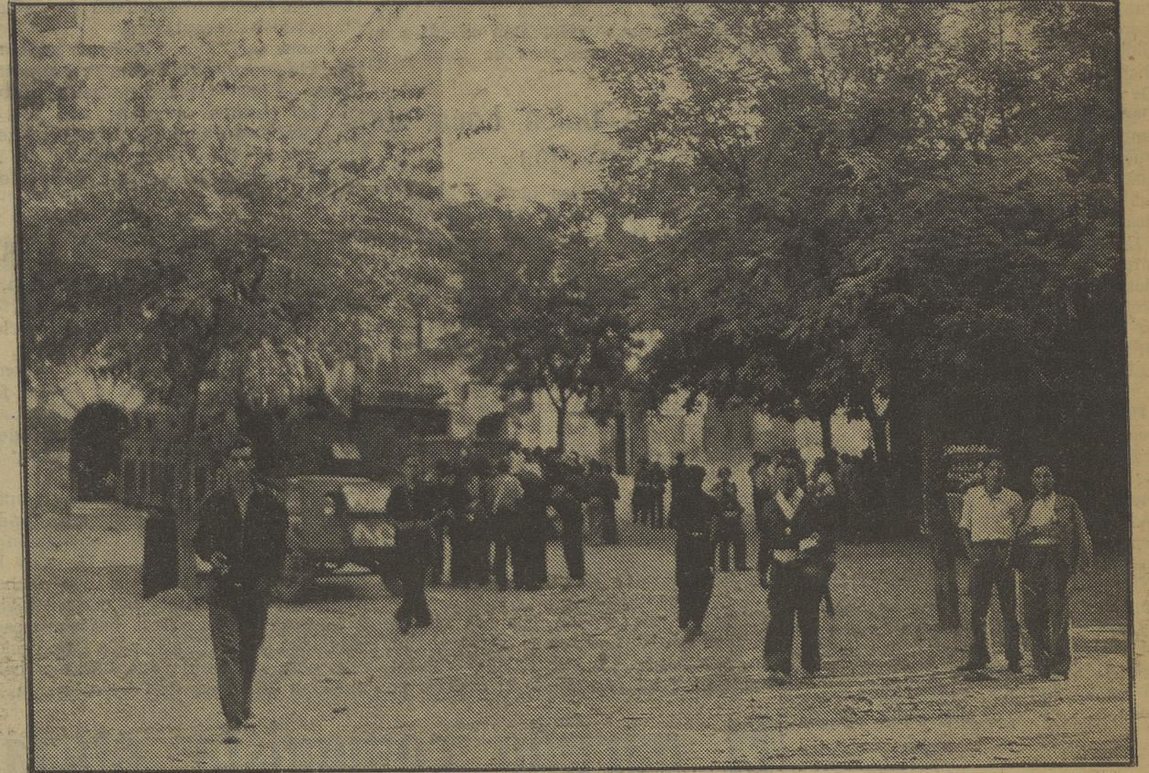
La plaza de Sariñena, cuartel general de nuestras columnas, ocupada por las milicias del P. O. U. M.

Entre todas las fuerzas leales reina gran entusiasmo por esta victoria, que tendrá una gran repercusión en la moral de los fasciosos.