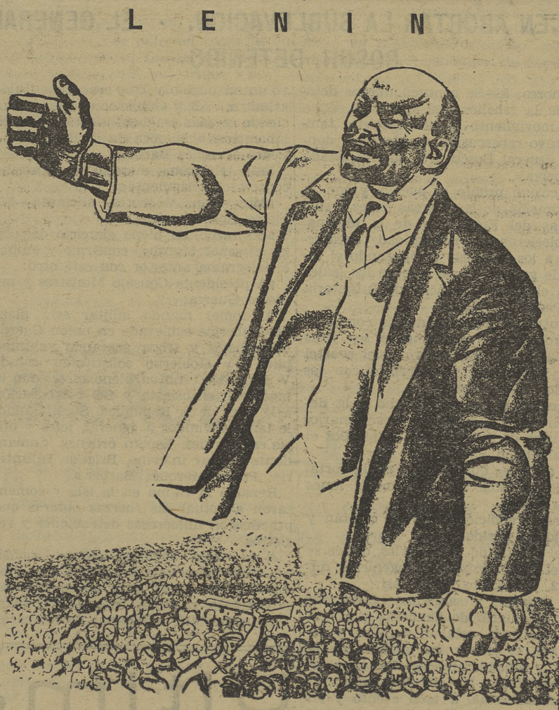
La figura ingente del forjador de la revolución rusa adquiere para los luchadores españoles perfiles rotundos y les señala el camino de la victoria.

El mundo entero contempla nuestra acción y espera nuestras determinaciones. Sepamos encauzar y realizar las aspiraciones sociales del proletariado.