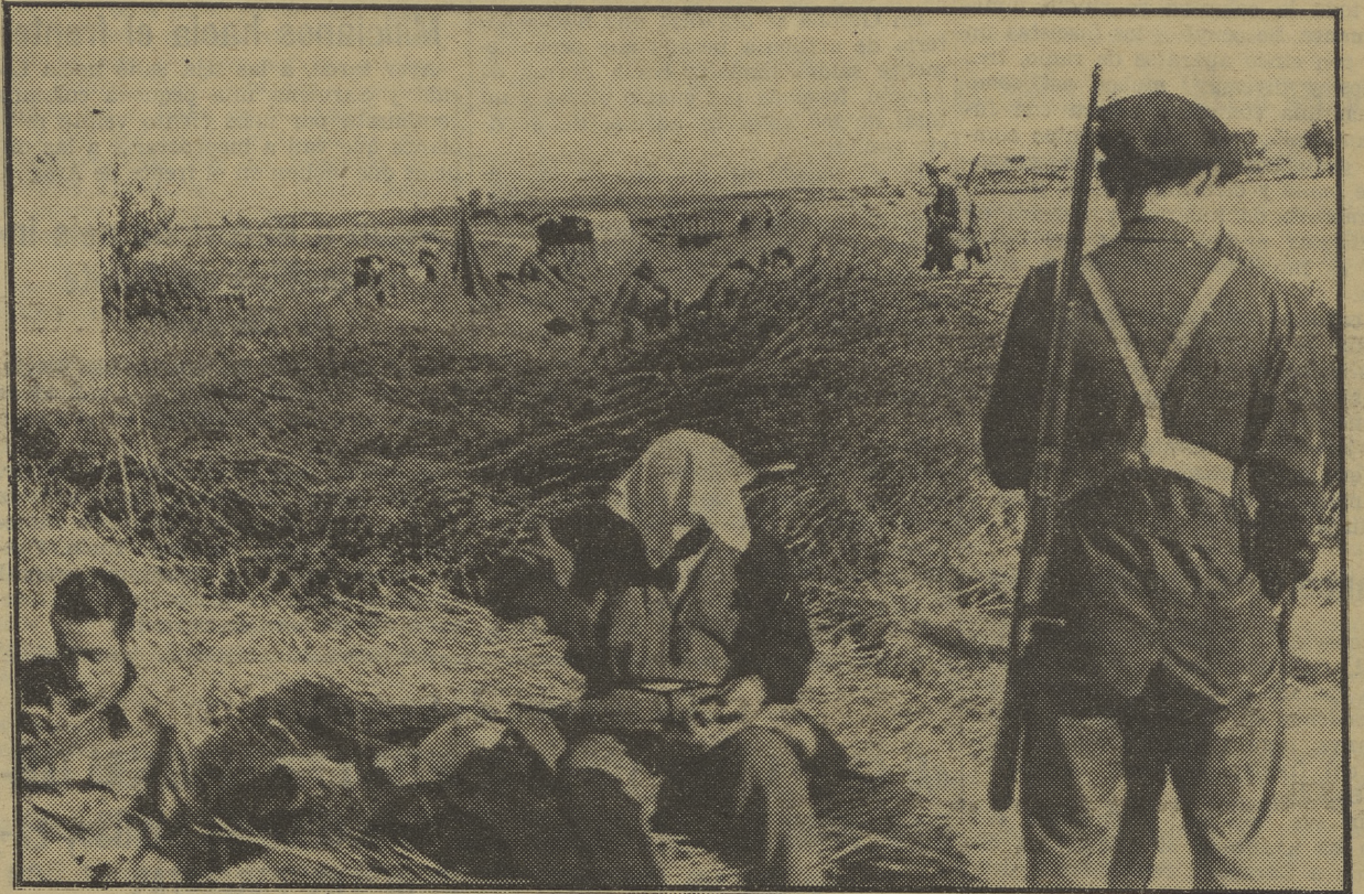
Un rato de descanso, bajo los ardientes rayos del sol, poco antes de la reedición de Sietamo, cerca de Huesca.