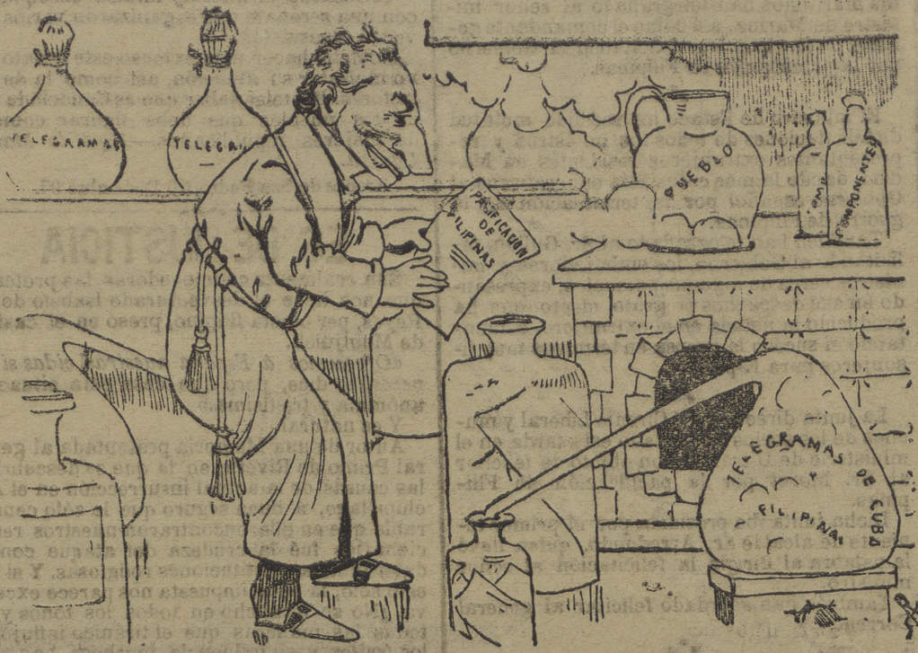
El gran Sagasta satisfecho del resultado obtenido por su último embotellado.