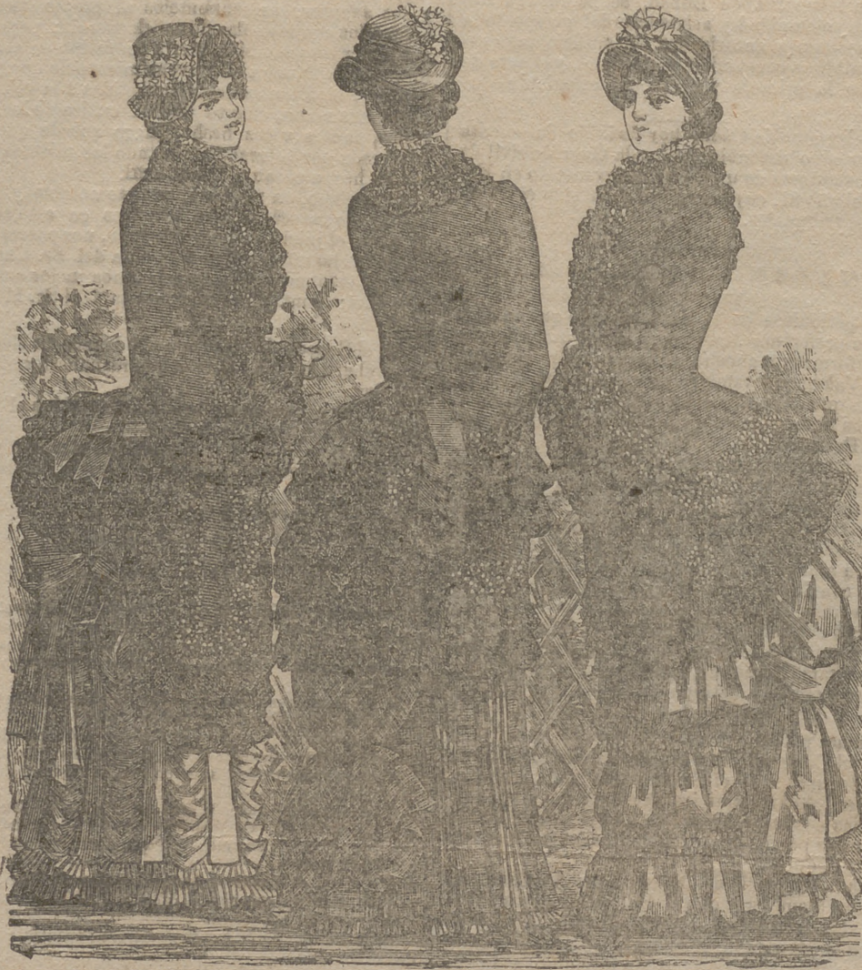
Abrigos y Manteletas, últimos modelos, desde 10 pesetas en adelante. Estos representan tres magníficos de 240 reales.