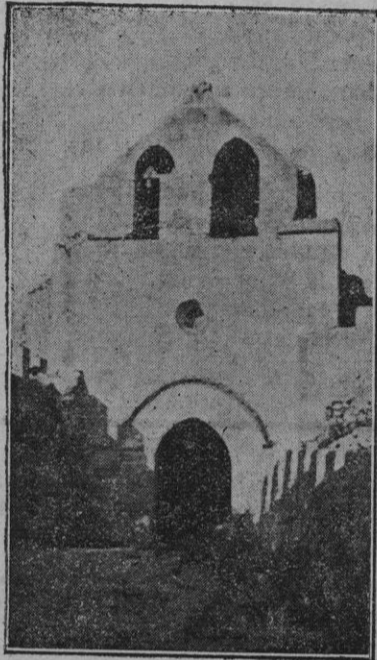
Oratorio del antiguo castillo de Capdepera

UNA CAJA CON CIEN CARTAS TELA tamaño ministro (22 ½ x 16 ½) con membrete impreso con tinta azul TRES PESETAS TRES De venta: Imprenta "LA ESPERANZA"