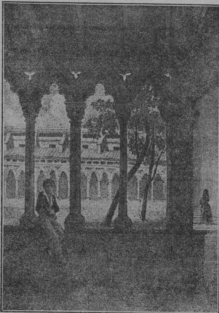
Del libro Souvenirs d'un voyage d'art a l'île de Majorque , por J. B. Laurens (1840). Otro aspecto del Claustro de San Francisco.