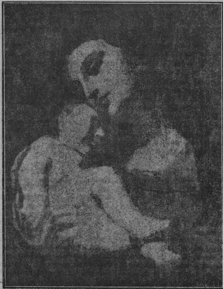
«Madonna», de autor desconocido obra perteneciente a la colección de pinturas de la Casa de Veri.