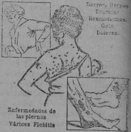
Enfermedades de las piernas Várices Fiebrís

Hacen falta muchachos. Calle de Ramón Berenguer n.º 12.