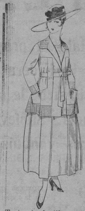
Traje de lanilla negro, azul y color bordado. a ptas. 90