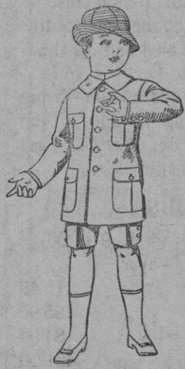
Trajes de lanilla, melton, etc., para niños de 4 a 9 años. De ptas. 16 a 33