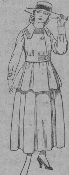
Trajes de lanilla negra, azul y color, para jovencitas de 13 a 16 años. De ptas. 50 a 55