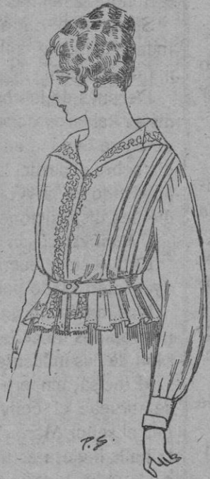
Blusa de crepón o seda en negro, azul y color. a ptas. 33