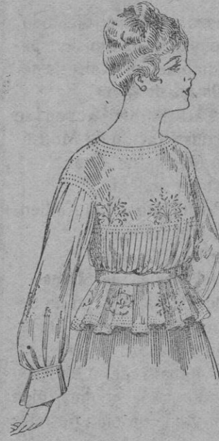
Blusa de voile blanco, bordados blanco rosa o azul. a ptas. 9