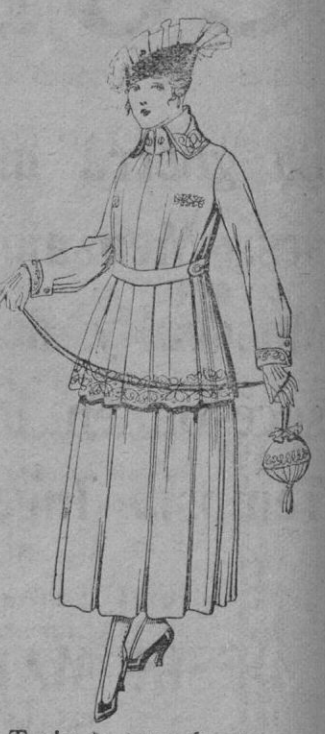
Traje de estambre negro, azul y color, bordado. De ptas. 90 a 93