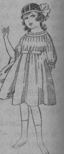
Vestidos de lanilla azul, para niñas de 4 a 9 años. De ptas. 22 a 25. Los mismos en voile. De ptas. 10 a 17