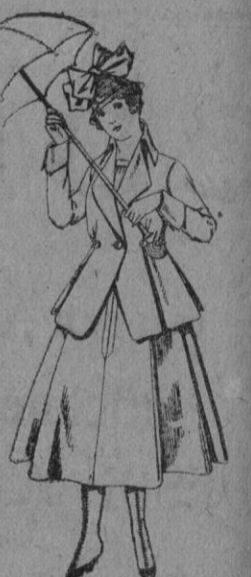
Trajes de lanilla para jovencitas de 13 a 16 años. De pts. 53 a 55