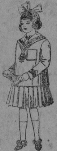
Trajes de lanilla para niñas de 4 a 12 años. De pts. 32 a 40