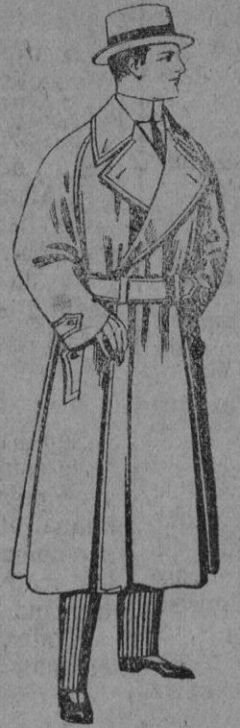
Gabanes Impermeabilizados en color beige. De pts. 65 a 110