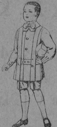
Trajes de lanilla para niños de 4 a 9 años. De pts. 12 a 31