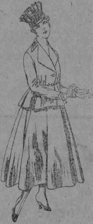
Trajes de lanilla para Señora a pts. 80