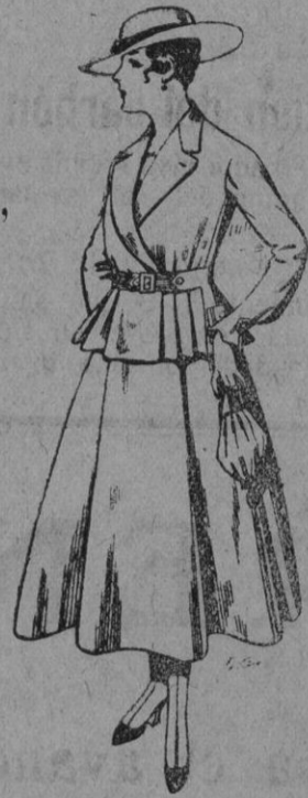
Trajes de lanilla para Señoras a pts. 70