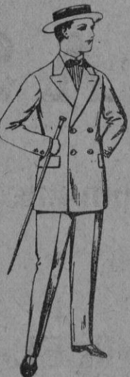
Trajes de lanilla para jovencitos de 10 a 16 años. De pts. 17 a 48