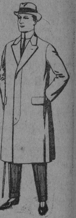
Pardessus de melton o vigonís. De pts. 25 a 100