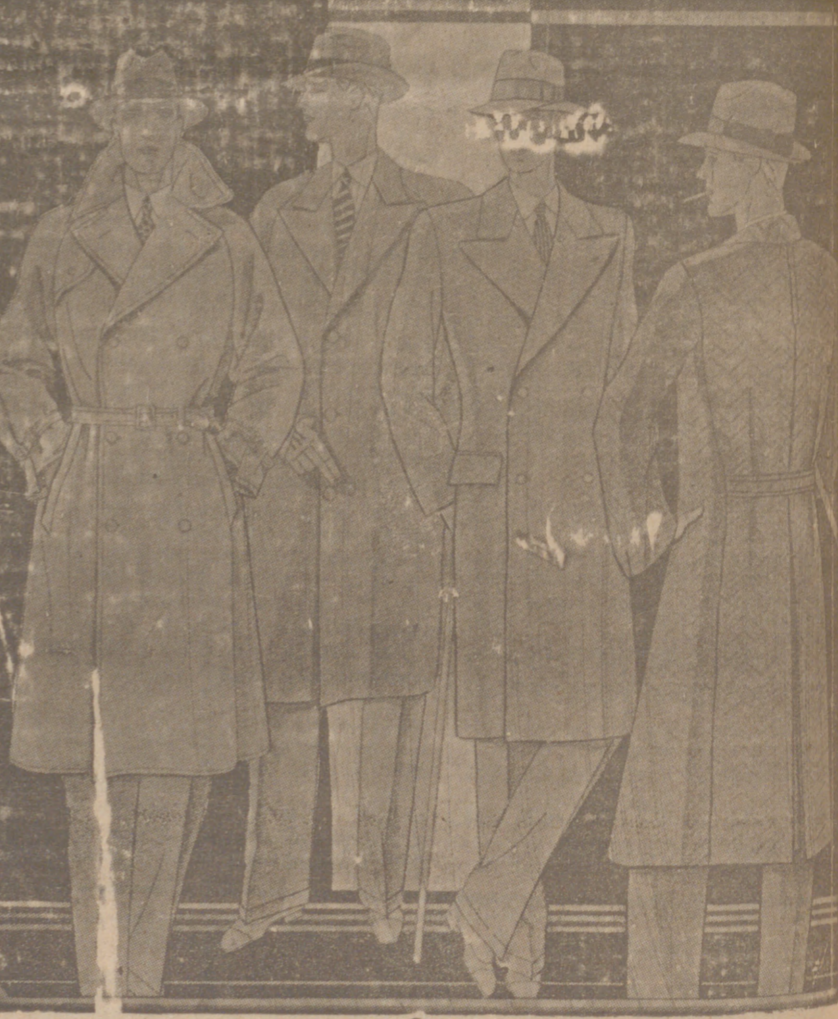
Cabanes caballero, a 40, 50, 60, 70, 80, 90, 100 y 150 pesetas. Gabanes pluma, a 90, 100, 125 y 150 ptas. Trincheras, a 20, 25 y 30 ptas. Gabardinas, a 40, 50, 60, 70 y 80 ptas. LA CASA MAS SURTIDA