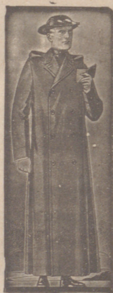
Guardapolvos de dril, a 20, 22 y 25 pesetas.