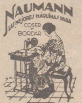
Máquinas coser NAUMANN. Bobina central. Precios más barato que nadie.