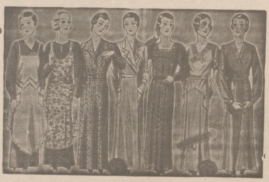
Vestidos, batas, kimonos de bañistas, percales o trapeales, de 7, 8, 9, 11, 12 y 14 pies

Casa Munguía Plaza Mayor, 48 y Lain Calvo, 9 Sucursal: Plaza Mayor, 5 BURGOS Primera casa en confecciones para caballero, señora, jóvenes y niños. Tejidos, Pañería y Sastrería