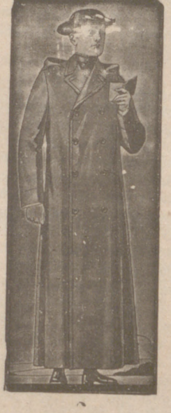
Guardapolvos de drill, a 20, 22 y 25 pesetas.