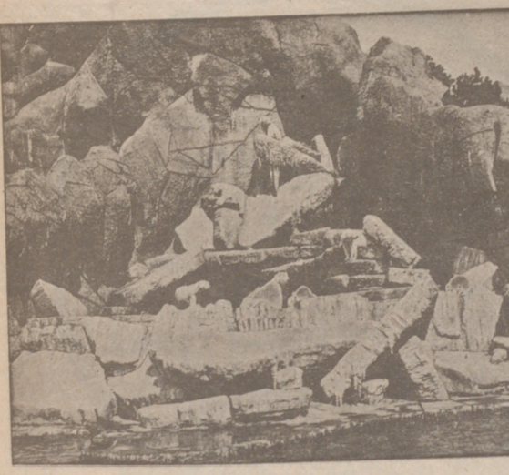
Una de las instalaciones del Parque de Hamburgo

MULTAS. Por la Alcaldía han sido multados: con 50 pesetas, un individuo, por encontrarse en estado de embriaguez y promover escándalo en el barrio del Hospital del Rey, molestando a varios vecinos de dicho barrio; con 5 cada uno, el conductor de un auto, por circular por el lado izquierdo de la Plaza de la República y un muchacho, por romper con una piedra un cristal de un faro de alumbrado público.