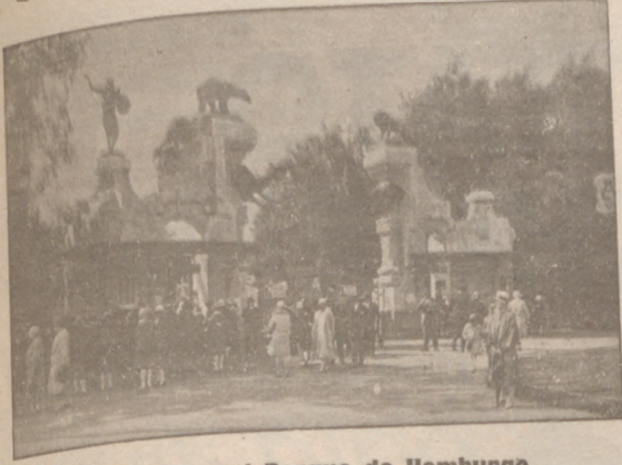
La entrada al Parque de Hamburgo