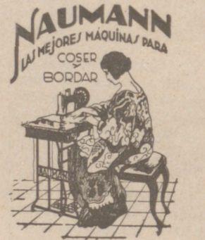
Máquinas coser NAUMANN. Bobina central. Precios más baratos que nadie.