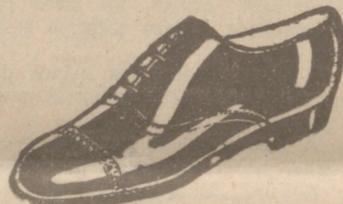
Zapatos los mejores, 18 ptas.