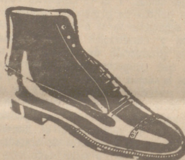
Botas las mejores, 19'80 ptas.

Venta directa del fabricante al consumidor