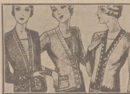
Blusas chaquetillas de 7, 8, 10, 12 y 15 ptas.