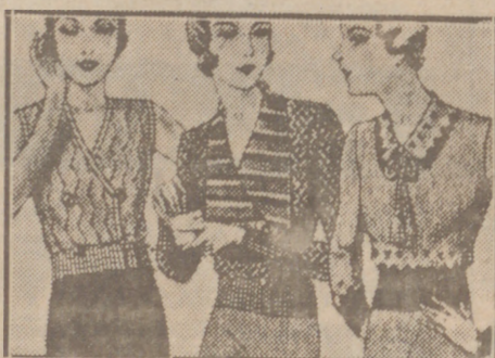
Blusas punto novedad a 5, 6, 8, 10 y 12 ptas.