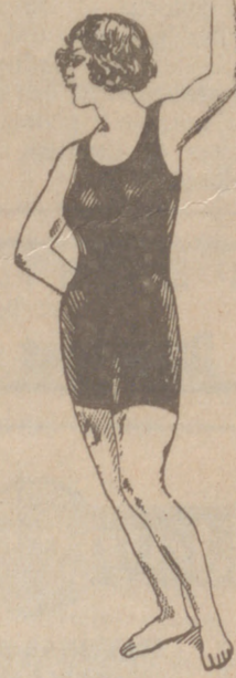
Trajes de baño en algodón o lana de 3,50, 4, 5, 6, 10, 12 y 15 ptas