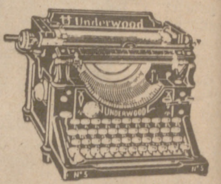
Máquinas escribir LINDERWOOD, admite papel de 26 centímetros de ancho, a 900 pts. Máquina 8/14 admite papel hasta 35 centímetros, a pesetas 1.000, según numeración.