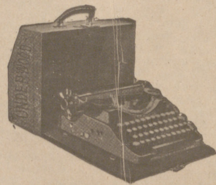
Máquina LINDERWOOD portátil último modelo, a 700 pesetas

Casa Munguía ( ) Plaza Mayor, 48 y Lain Calvo, Sucursal: Plaza Mayor, 5 BURGOS Primera casa en confecciones para caballero, señora, jóvenes y niños Tejidos, Pañería y Sastrería