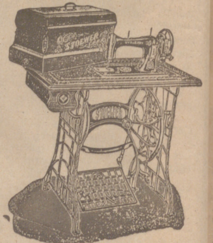
Máquinas coser, bobina central, de 350, 400, 450 y 500 pesetas. Alemanas. Enseñanza de bordar y preparado de costura.

Sección especial de efectos de oficina y máquinas de escribir LINDERWOOD. Habiendo concertado con una casa de Nueva York la venta directa de máquinas de escribir LINDERWOOD, recomiendo que antes de efectuar sus compras vea PRECIOS y ciudades de estas máquinas.