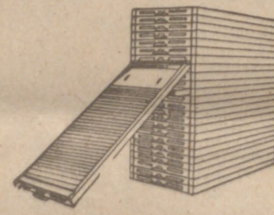
Ficheros de acero. El mejor y más barato. Pida folletos y precios. El fichero más práctico y visible.