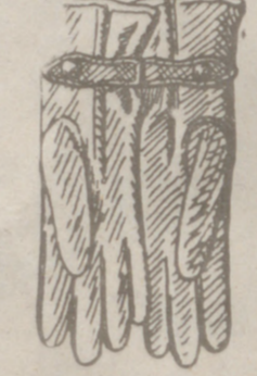
Guantes piel caballero forrados, a 8, 10, 12, 15 y 16 pesetas de manopla.