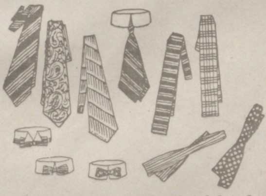
Corbatas novedad, a 0.50, 0.75, 1, 2, 3, 4 y 5 pesetas una.