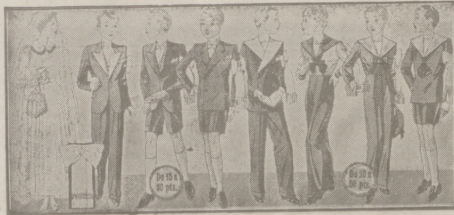
Diversidad de modelos para primera comunión, desde 20 a 60 pesetas. En blanco, gris y colores novedad.

Casa Munguía Plaza Mayor 42 y Lata Calvo 8 Sucursal: Plaza Mayor, 5 BURGOS Primera casa en confecciones para caballero, señora, jóvenes y niños. — Tejidos, Pañería y Sastrefía.