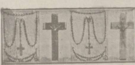
Crucifijos y rosarios de todos los precios, para 1.ª comunión.