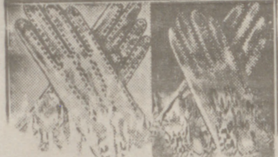
Guantes blancos, de 1.ª, 2.ª, 3.ª y 4.ª mano.