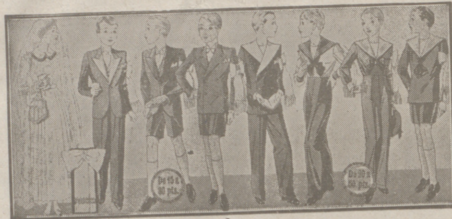
Diversidad de modelos para primera comunión, desde 20 a 60 pesetas. En blanco, gris y colores novedad.

Casa Munguía Plaza Mayor 42 y Lalm Calvo 6 Sucursal: Plaza Mayor, 5 BURGOS Primera casa en confecciones para caballero, señora, jóvenes y niños. — Tejidos, Pañería y Sastrería.