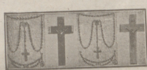
Crucifijos y rosarios de todos los precios, para 1.ª comunión.