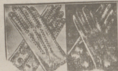
Gautes blancos, de 1.º 25, 1.º 50 y 2 pesetas.