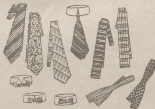
Corbatas novedad, a 0,50, 0,75, 1, 2, 5, 4 y 5 pesetas una.