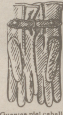
Gautes piel caballero forrados, a 8, 10, 12, 15 y 16 pesetas de manopla.