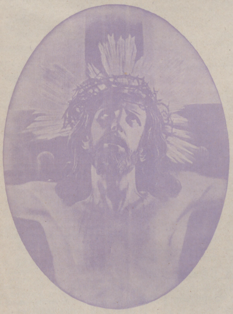
La veneradísima imagen del Santo Cristo de Limpas