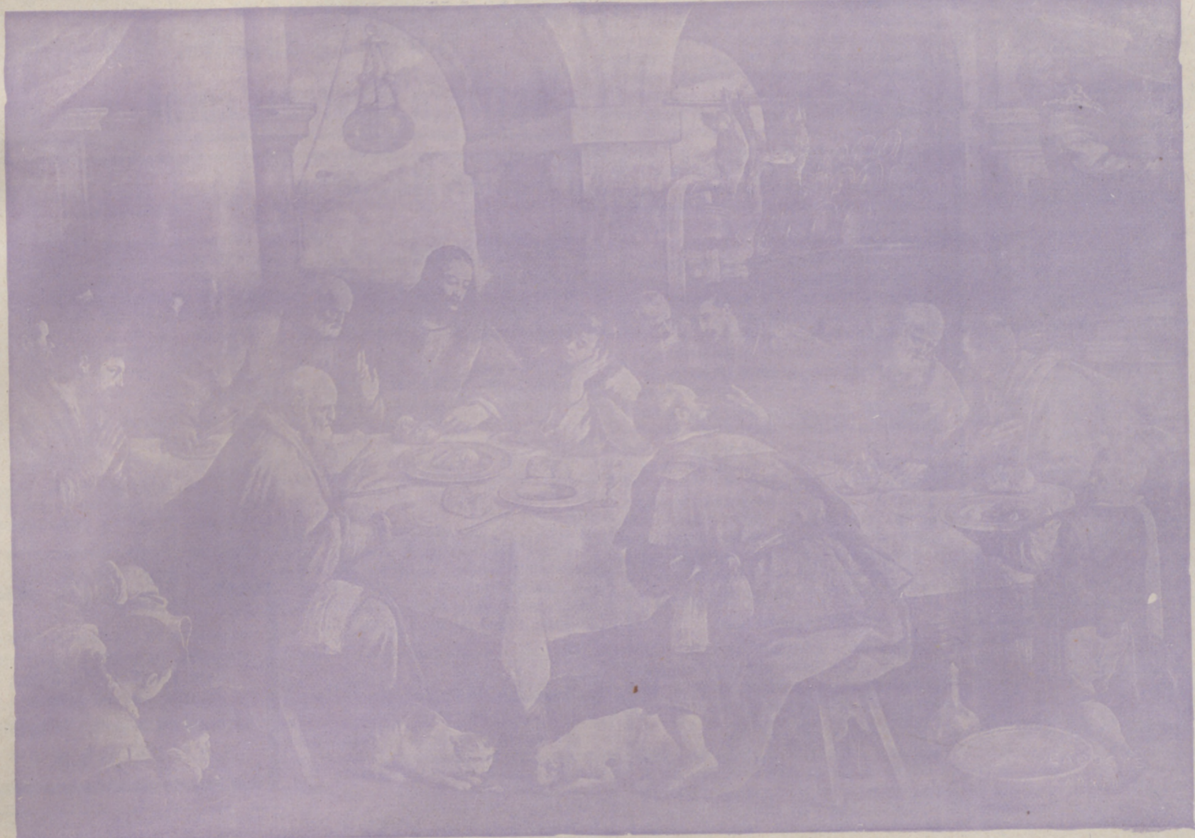
La última cena.—Basano, Museo del Prado, Madrid.