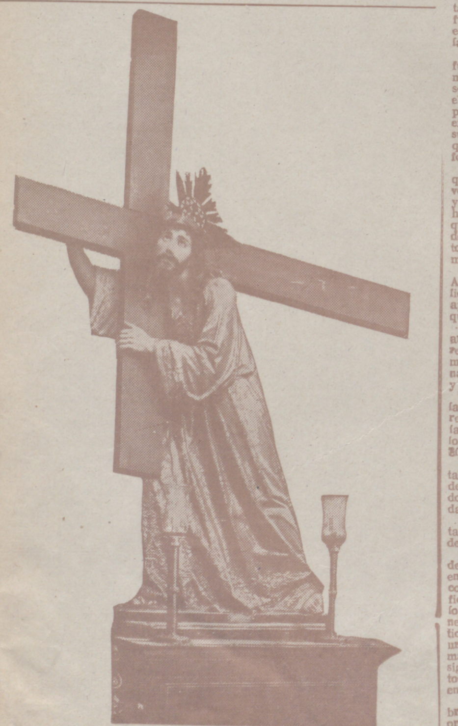
Jesús con la Cruz a cuestas