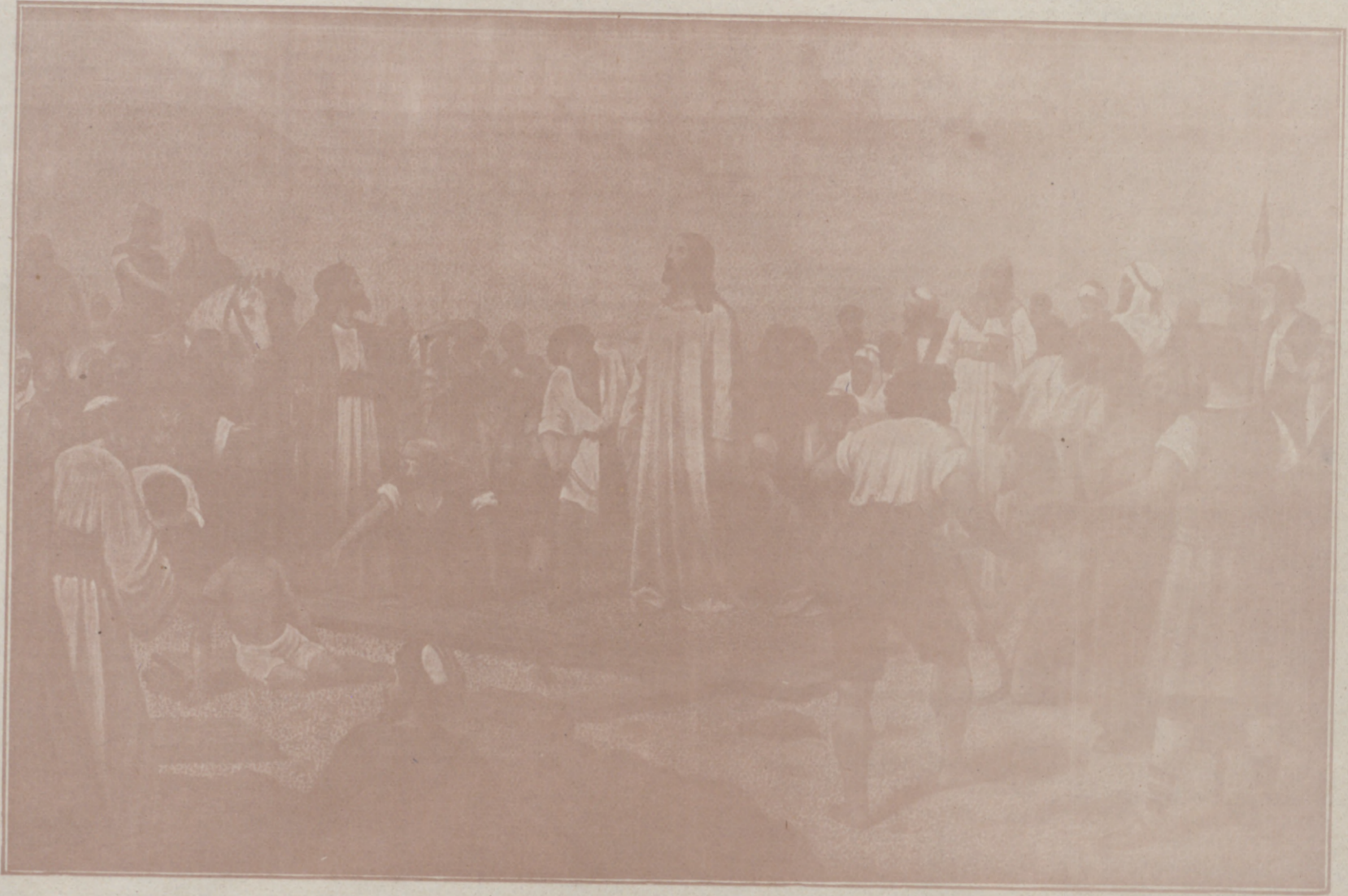
En la cumbre del Gólgota.—Momentos antes de la crucifixión