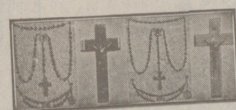
Crucifijos y rosarios de todos los precios, para 1.ª comunión.