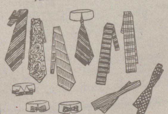
Corbataz novedad, a 0'50, 0'75, 1, 2, 5, 4 y 5 pesetas una.