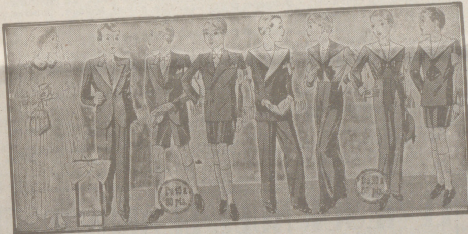
Diversidad de modelos para primera comunión, desde 20 a 60 pesetas. En blanco, gris y colores novedad.

Primera casa en confecciones para caballero, señora, jóvenes y niños. — Tejidos, Pañería y Sastrería.