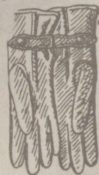
Gautes piel caballero forrados, a 8, 10, 12, 15 y 16 pesetas de manopla.

FABRICA DE LIBROS RAYADOS, DIARIOS, MAYORES COPIADORES, ACTAS, ENCHADERNACIONES, BTG CAJAS DE CARTÓN EN GRAN ESCALA