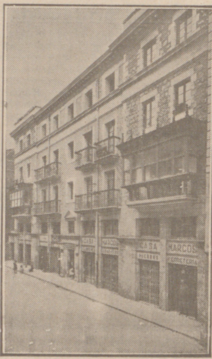
Fachada, por la calle de la Moneda números 16 y 17, de la CASA SOCIAL propiedad de la Federación Burgalesa de Sindicatos Agrícolas Católicos.

Se hallan establecidas en su planta baja las Oficinas y talleres de máquinas de «El Castellano» y «El Defensor de los Labradores»