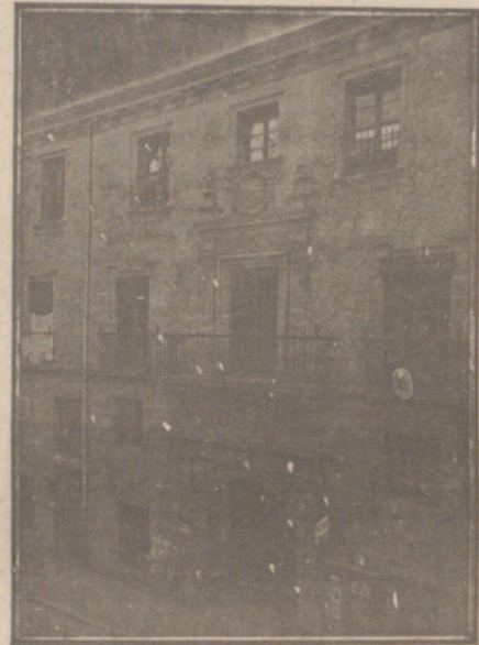
Entrada a las Oficinas de la Federación y MUTUALIDAD AGRÍCOLA BURGALESA. Calle de Santander, números 10, 12 y 14, Burgos.

Un accidente en vuestros obreros, criados, pastores o en vosotros mismos, puede causar grave daño económico o la ruina en vuestra casa.