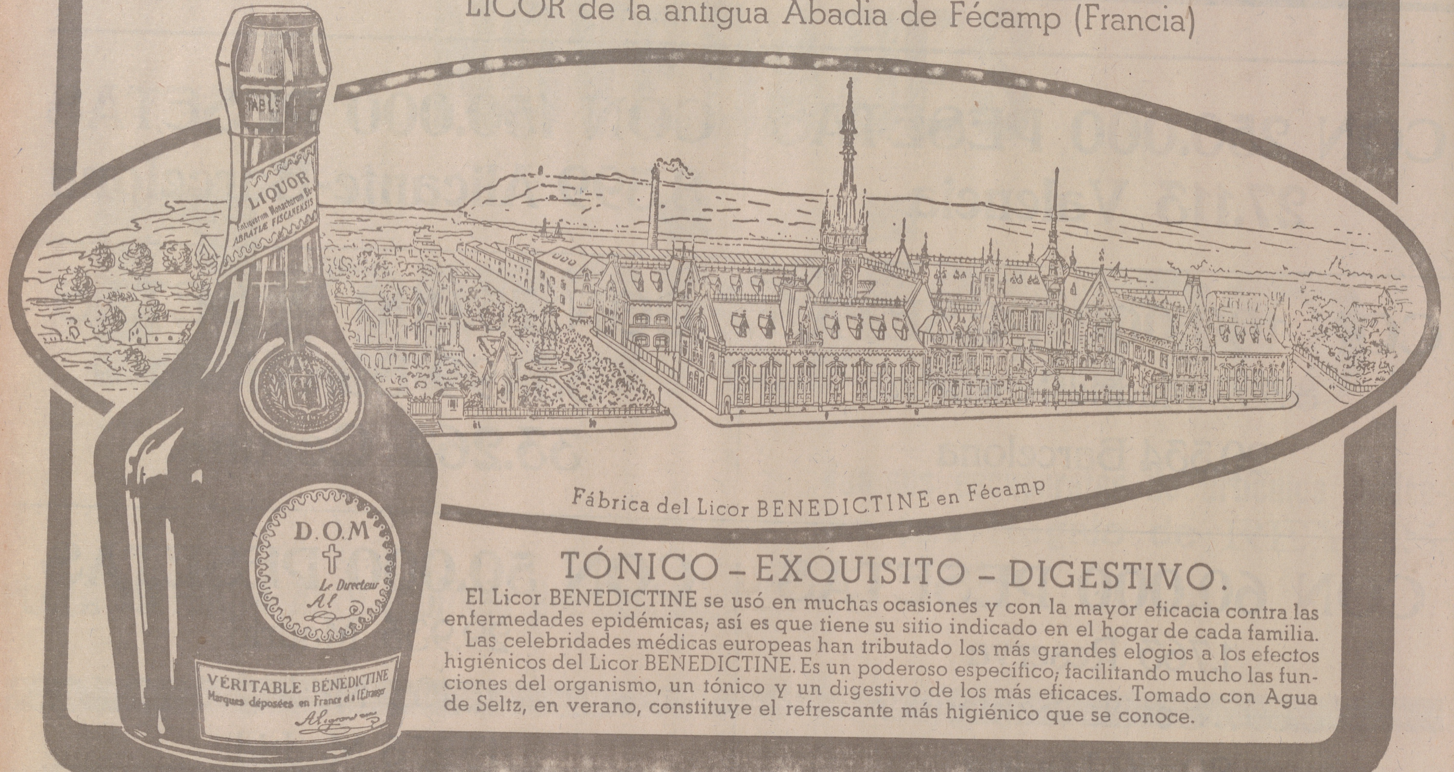
Fábrica del Licor BÉNEDICTINE en Fécamp

LICOR de la antigua Abadía de Fécamp (Francia)