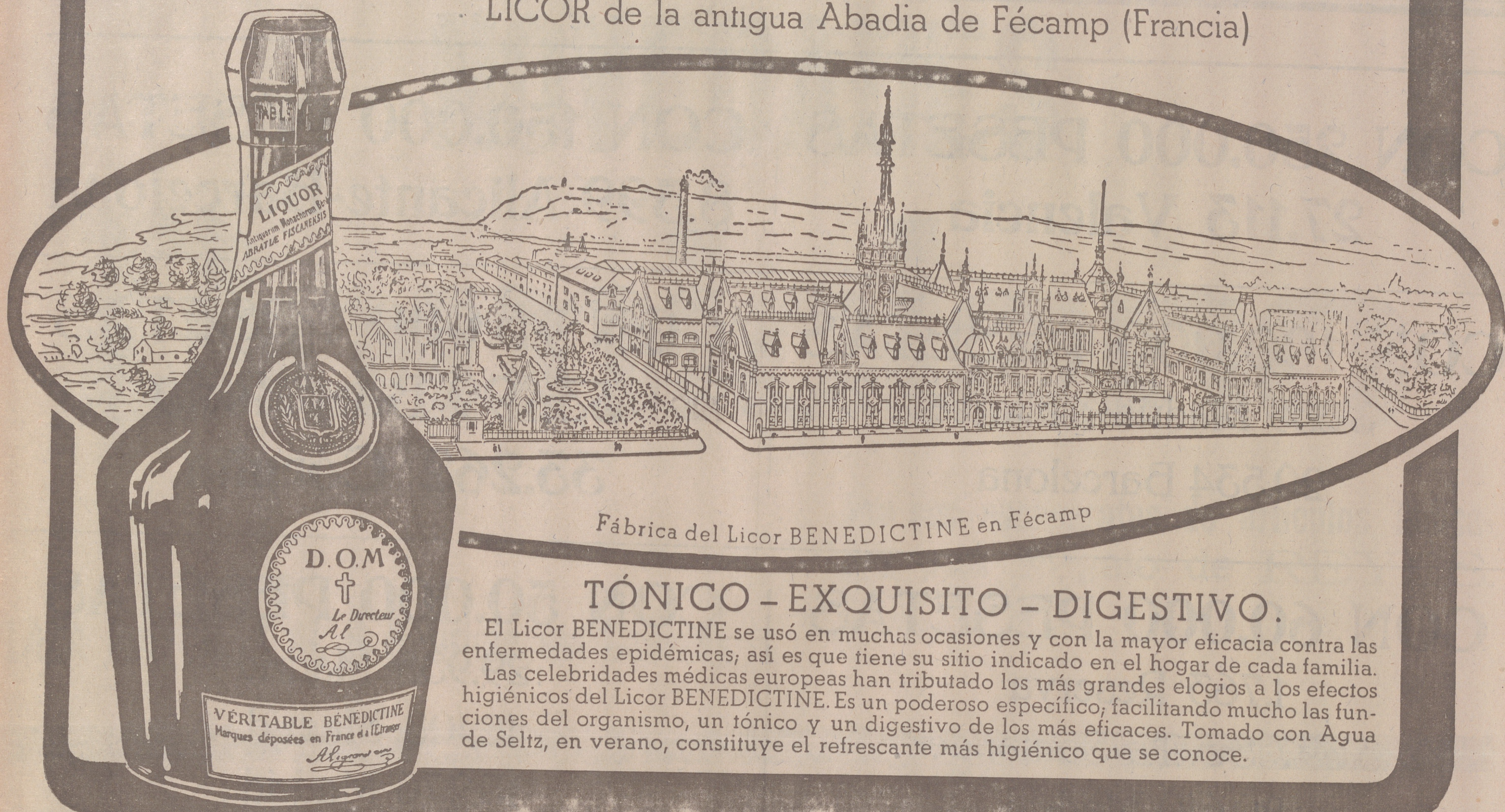
Fábrica del Licor BENEDICTINE en Fécamp

LICOR de la antigua Abadía de Fécamp (Francia)