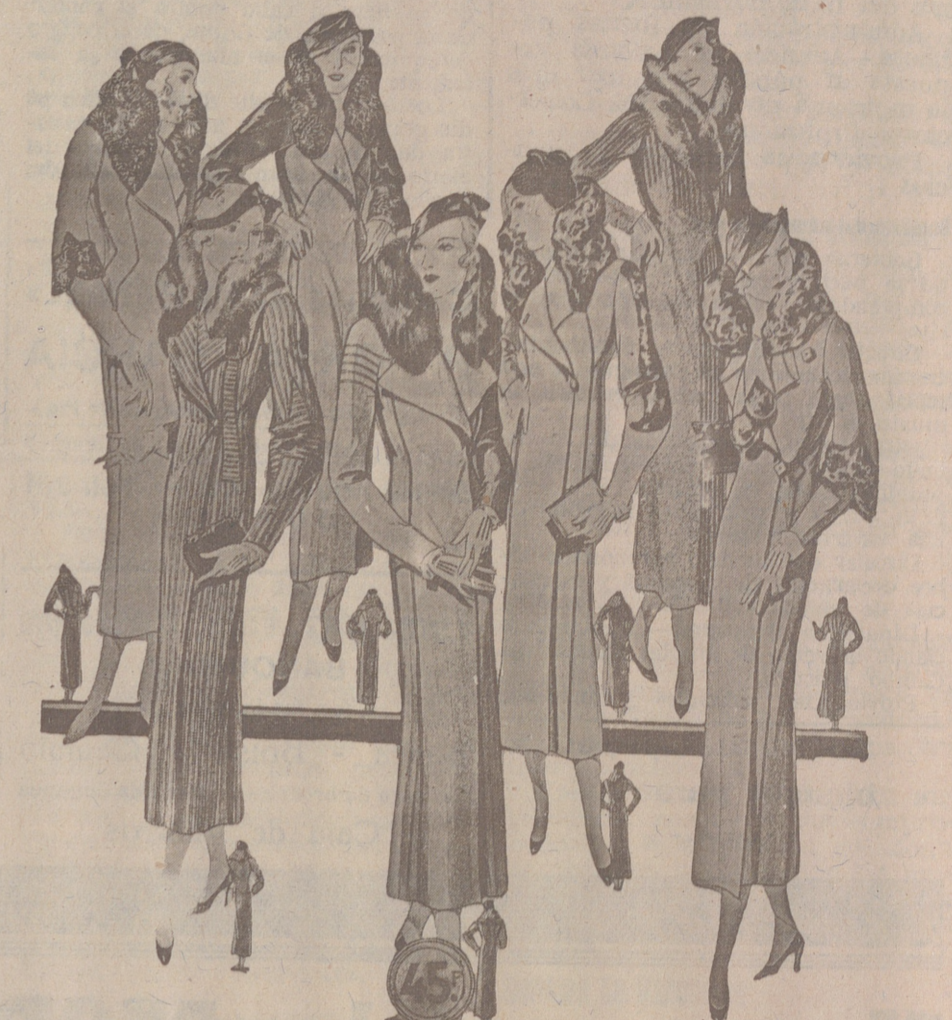
50 Modelos distintos en Abrigos Gamuzas NOVEDAD. — Modelos, creación Parísien a 25, 30, 40, 50, 60, 70, 80 y 100 pesetas