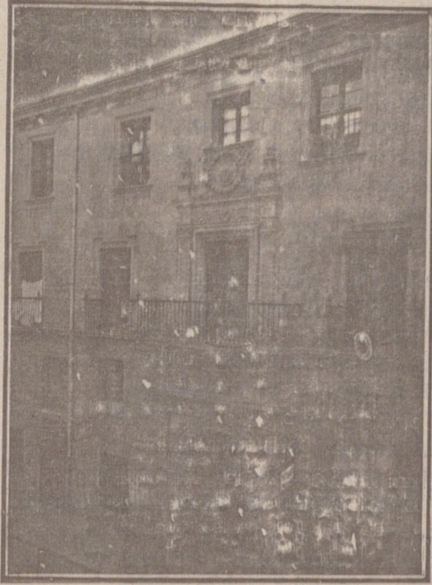
Entrada a las Oficinas de la Federación y MUTUALIDAD AGRÍCOLA BURGALESA. Calle de Santander, números 10, 12 y 14, Burgos.

En ella están las Oficinas de la FEDERACIÓN, CAJA DE AHORROS, MUTUALIDAD AGRÍCOLA BURGALESA y Redacción y Administración de «El Castellano» y «El Defensor de los Labradores»