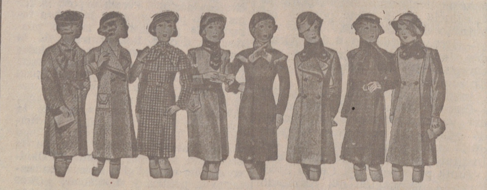
ABRIGOS PARA NIÑAS — MODELOS NOVEDAD, de 15, 18, 20, 25, 30 y 40 pesetas.

Primera casa en confecciones para caballero, señora, jóvenes y niños. — Tejidos, Pañería y Sastrería.