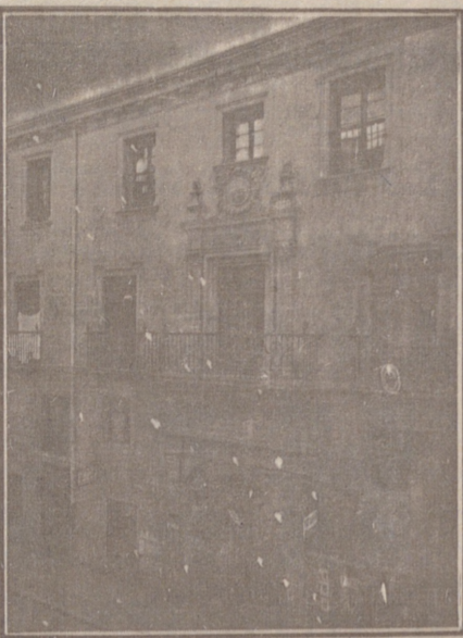
Entrada a las Oficinas de la Federación y MUTUALIDAD AGRÍCOLA BURGALESA. Calle de Santander, números 10, 12 y 14. Burgos.

En ella están las Oficinas de la FEDERACIÓN, CAJA DE AHORROS, MUTUALIDAD AGRÍCOLA BURGALESA y Redacción y Administración de «El Castellano» y «El Defensor de los Labradores»