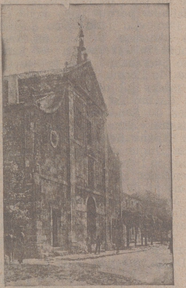
Iglesia de San Juan y Ayuntamiento