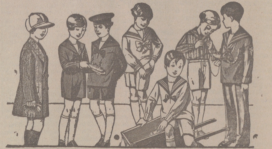
50 modelos distintos en trapecitos para niños en dril, en pana, en paño, y en jergas azules, de 10 a 40 pesetas.

Plaza Mayor 42 y Lalm Calvo 9 Sucursal: Plaza Mayor, 5 BURGOS Primera casa en confecciones para caballero, señora, jóvenes y niños. — Tejidos, Pañería y Sastrería.