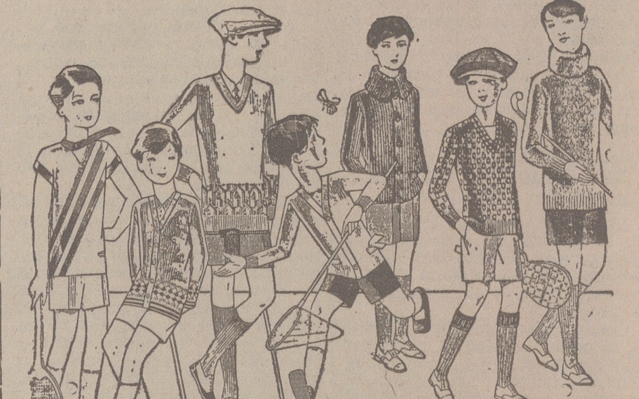
Jerseys para niños, dibujos novedad, desde 4, 4,50 5, 6, 7, 8, 10 y 12 ptas. Siempre gran surtido para elegir