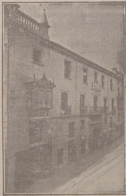
Fachada, por la calle de Santander, 10, 12 y 14, de la CASA SOCIAL propiedad de la Federación burgalesa de Sindicatos Agrícolas Católicos.

En ella están las Oficinas de la FEDERACIÓN, CAJA DE AHORROS, MUTUALIDAD AGRÍCOLA BURGALESA y Redacción y administración de «El Castellano» y «El Defensor de los Labradores».