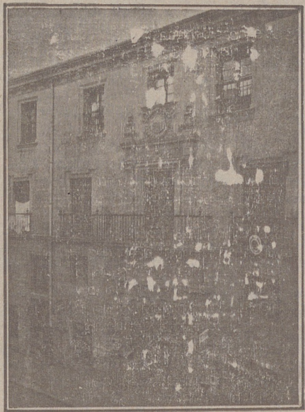
Entrada a las Oficinas de la Federación y MUTUALIDAD AGRÍCOLA BURGALESA Calle de Santander, números 10, 12 y 14 Burgos

Un accidente en vuestros obreros, criados, pastores o en vosotros mismos, puede causar grave daño económico o la ruina en vuestra casa.