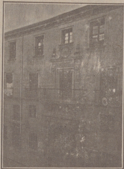
Entrada a las Oficinas de la Federación y MUTUALIDAD AGRÍCOLA BURGALESA Calle de Santander, números 10, 12 y 14 Burgos

Un accidente en vuestros obreros, criados, pastores o en vosotros mismos, puede causar grave daño económico o la ruina en vuestra casa.