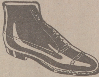
Botas clase 1.ª «Segarra», a 19'50, pesetas. Piel de hierro, a 19'50. Piel de hierro piso goma, a 18 pías.