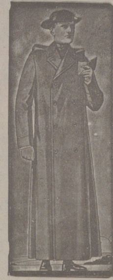
Impermeables, de 90, 100 y 115 pías. Guardapolvos de drill forma dultea, a 18, 20 y 25 pías.