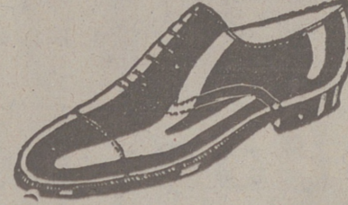
Zapatos piel de 1.ª, del 38 al 45, a 18 pías. Zapato charol, a 19'50. LIMPIEZA GRATIS