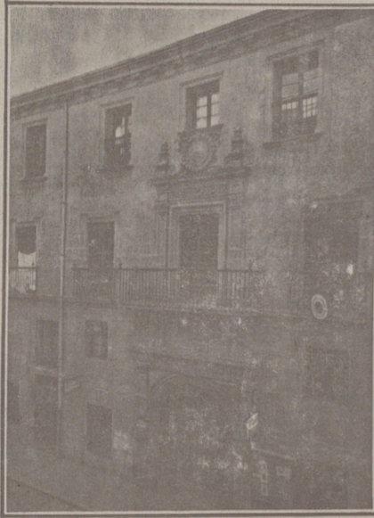
Entrada a las Oficinas de la Federación y MUTUALIDAD AGRÍCOLA BURGALESA Calle de Santander, números 10, 12 y 14 Burgos

Fachada, por la calle de Santander, 10, 12 y 14, de la CASA SOCIAL propiedad de la Federación Burgalesa de Sindicatos Agrícolas Católicos.