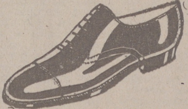
Zapatos piel de 1.ª, del 58 al 46, a 18 ptas. Zapato charol, a 19'50. LIMPIEZA GRATIS