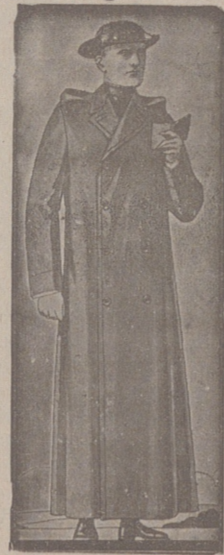
Impermeables, de 90, 100 y 115 ptas. Guardapolvos de dril forma dullela, a 18, 20, 25 y 50 ptas.