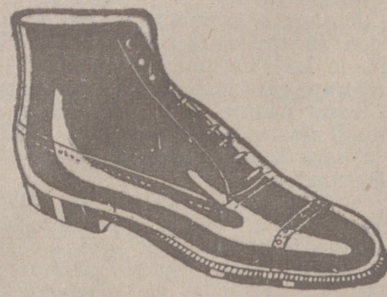
Botas clase 1.ª «Segarra», a 19'50. pesetas. Piel de hierro, a 19'50. Piel de hierro piso goma, a 18 ptas.