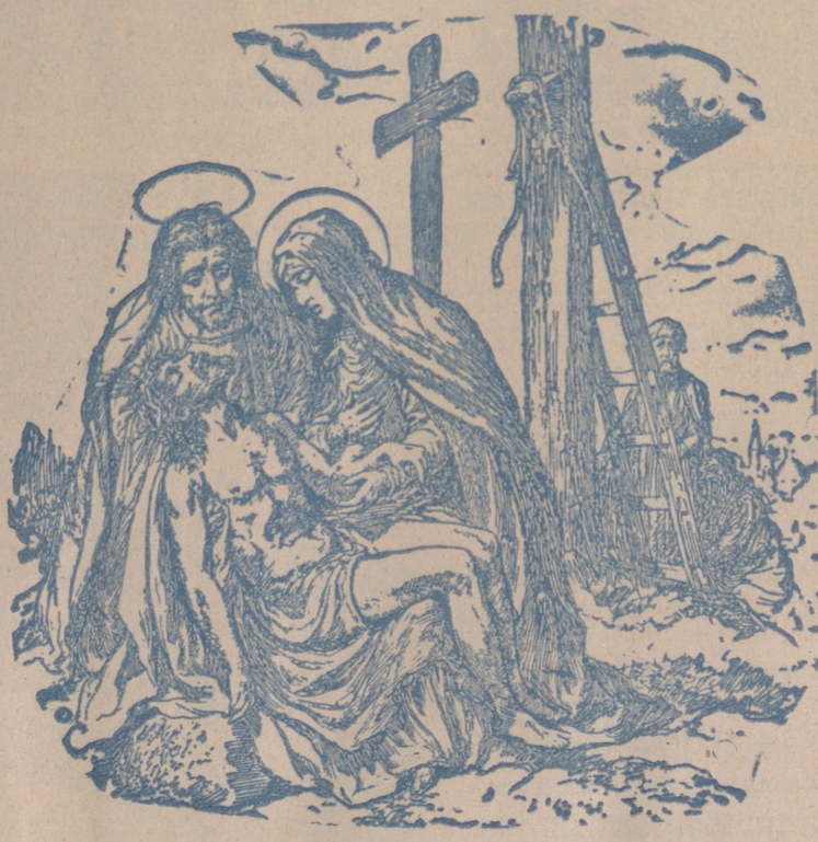
El descendimiento de la cruz