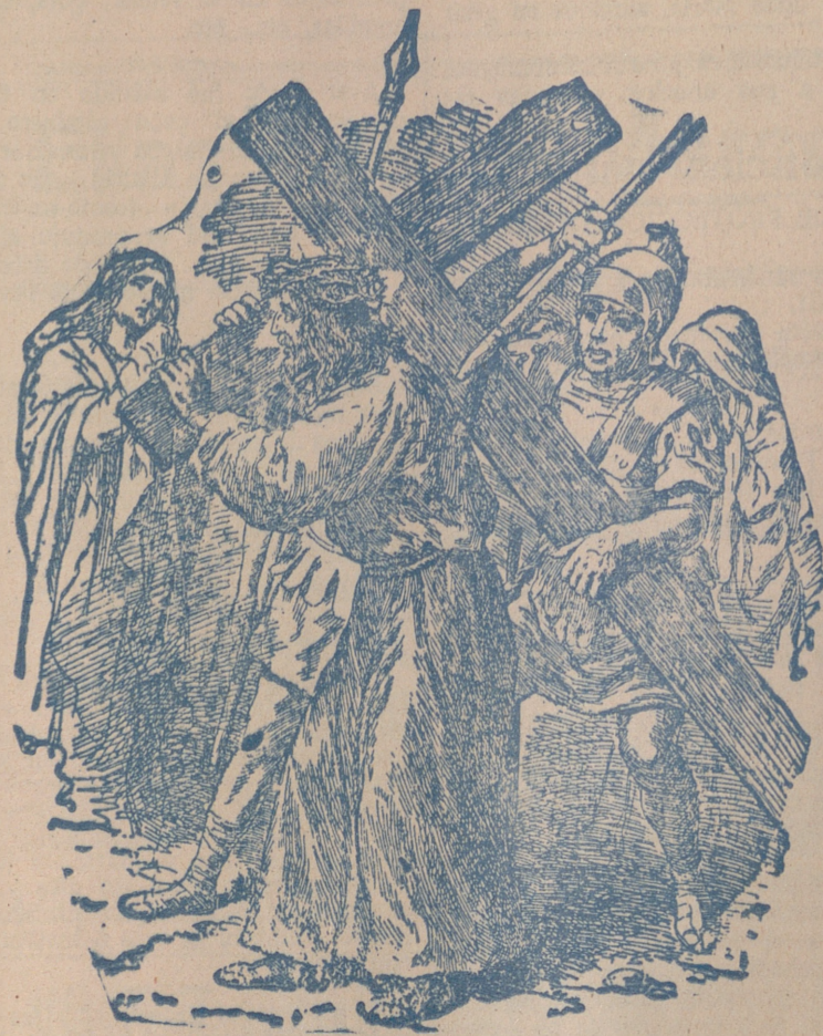
Jesús con la cruz a cuestas