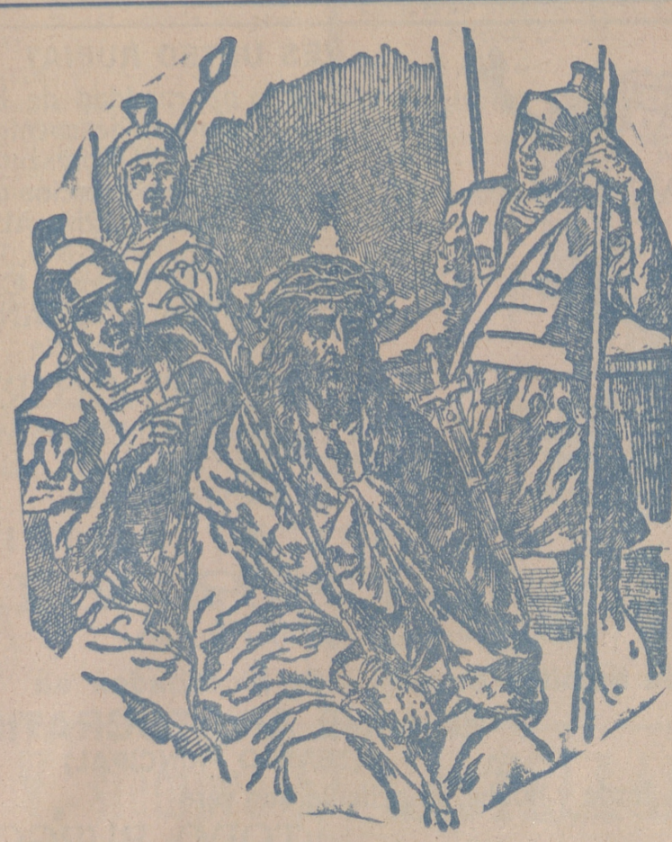
Jesús coronado de espinas