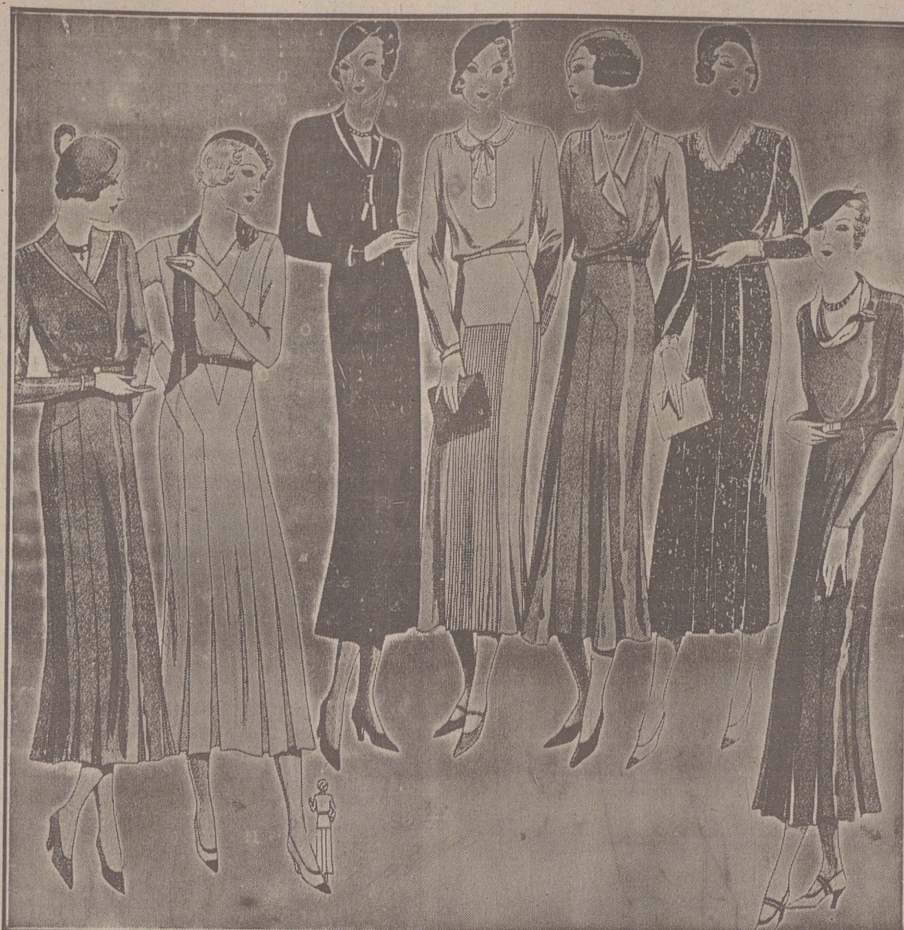
Vestidos de crepón y lana, modelos novedad, de 25, 30, 40, 50 y 60 pesetas.

Casa Munguía Plaza Mayor 42 y Lain Calvo 3 Sucursal: Plaza Mayor, 15 BURGOS Primera casa en confecciones para caballero, señora, jóvenes y niños. — Tejidos, Pañería y Sastrería.