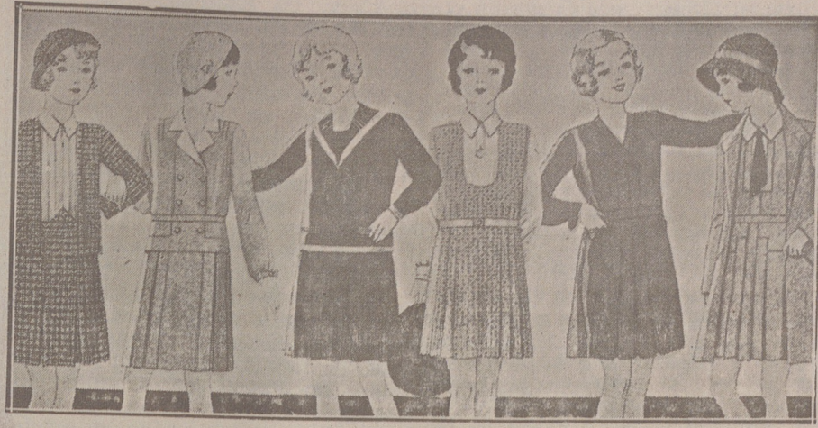
Vestiditos de lana, crespón seda y punto lana, edad de 8 a 14 años, a 14, 16, 18, 20 y 25 pesetas.

Casa Munguía :: Plaza Mayor 42 y Lain Calvo 3 Sucursal: Plaza Mayor, 15 BURGOS Primera casa en confecciones para caballero, señora, jóvenes y niños. — Tejidos, Pañería y Sastrería.