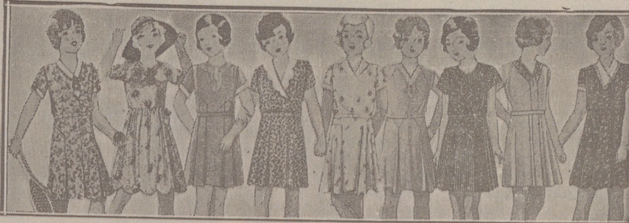
Vestiditos niñas edad de 5 a 10 años, en lana, crespón o punto a 10, 12, 15, 16, 18 y 20 pesetas.