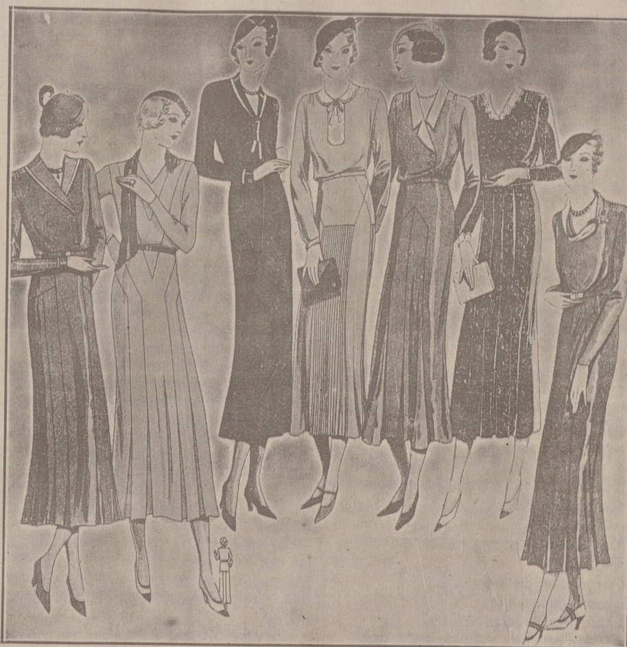
Vestidos de crepón y lana, modelos novedad, de 25, 30, 40, 50 y 60 pesetas.

Casa Munguía Plaza Mayor, 42 y Lain Calvo 9. Sucursal: Plaza Mayor, 5 BURGOS Primera casa en confecciones para caballero, señora, jóvenes y niños. — Tejidos, Pañería y Sastrería.