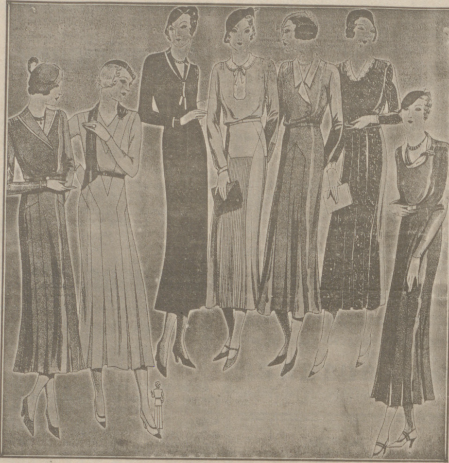
Vestidos de crepón y lana, modelos novedad, de 25, 50, 40, 50 y 60 pesetas.

Casa Munguía :: Plaza Mayor, 42 y Lain Calvo 9 Sucursal: Plaza Mayor, 5 BURGOS Primera casa en confecciones para caballero, señora, jóvenes y niños. — Tejidos, Pañería y Sastrería.