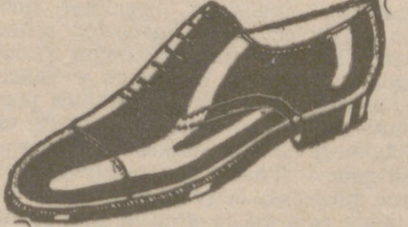
Zapatos todos los números, a 18 pesetas.—Charol, a 19'80. Cosido todo.