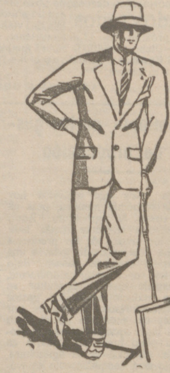
Trajes de paño, confección fina, de 80, 60, 70, 80, 100 y 125 ptas.