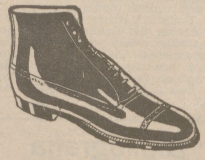
Botas en negro o color, a 19'80.—Piel de hierro, 19'80.—Piso goma, 18'00.—Fuerte campo, 16'75.