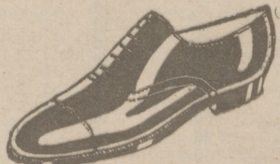
Zapatos todos los números, a 18 pesetas.—Charo, a 19'50.—Cosido todo.