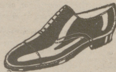
Zapatos todos los números, a 18 pesetas.—Charol, a 19'50.—Cosido todo.