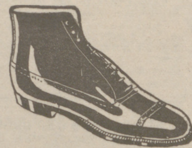
Botas en negro o color, a 19'50.—Piel de hierro, 19'50.—Piso goma, 18'00.—Fuerte campo, 16'75.