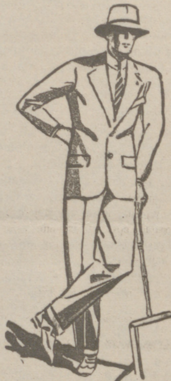
Trajes de paño, confección fina, de 80, 60, 70, 80, 100 y 125 ptas.