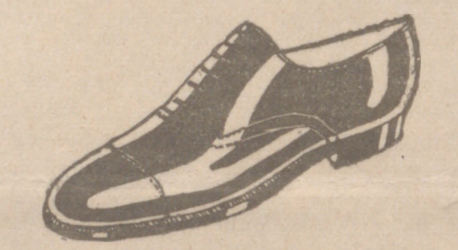
Zapatos en cinco colores distintos a 18 pesetas Zapato Charol, a 19'50

CALZADOS SEGARRA TODO COSIDO GOODYEAR Venta directa del Fabricante al consumidor