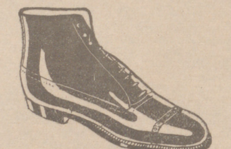
Botas en negro y color todo cosido a 19'50 pesetas EXPOSICION Y VENTA

Casa Munguía PLAZA MAYOR, 42 LAIN CALVO 9 Y 11 BURGOS